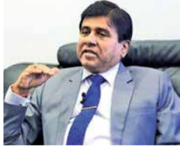
எதிர்கால அரசாங்கங்களை வலுப்படுத்தும் நோக்கத்தில் எந்த ஏற்பாடுகளும் உத்தேச சட்டத்தில் இல்லை எனவும் விஜயதாச சுட்டிக்காட்டினார். (அ)

காணப்படும் சட்டங்களை அடிப்படையாகவைத்து உத்தேச பயங்கரவாத தடைச்சட்டங்களை உருவாக்கியுள்ளதாகவும் நீதியமைச்சர் குறிப்பிட்டார். தற்போதைய பயங்கரவாத தடைச்சட்டத்தின் கீழ் பாதுகாப்பு அமைச்சருக்கு வழங்கப்பட்டுள்ள அதிகாரங்கள் பல வற்றை உத்தேச சட்டம் நீக்குகின்றது எனவும் அவர் கூறினார். பொதுமக்களை பாதுகாப்பதற்கான ஏற்பாடுகளே உத்தேச சட்டத்தில் காணப்படுகின்றன.