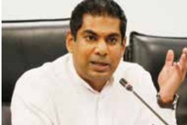
கொழும்பு, ஏப். 19 இலங்கை மின்சார சபையின் மறுசீரமைப்பு செயல்முறையின்

முன்மொழியப்பட்ட வரைபடத்துக்கும் கால அட்டவணைக்கும் அமைச்சரவை அங்கீகாரம் வழங்கியுள்ளதாக மின்வலு மற்றும் எரிசக்தி அமைச்சர் கஞ்சன விஜேசேகர தெரிவித்தார். அதன்படி, மே மாத இறுதிக்குள் புதிய மின்சார சட்டத்தின் இறுதி வரைவு பாராளுமன்றத்தின் ஒப்புதலுக்காக சமர்ப்பிக்கப்படும் என மேலும் கூறினார்.