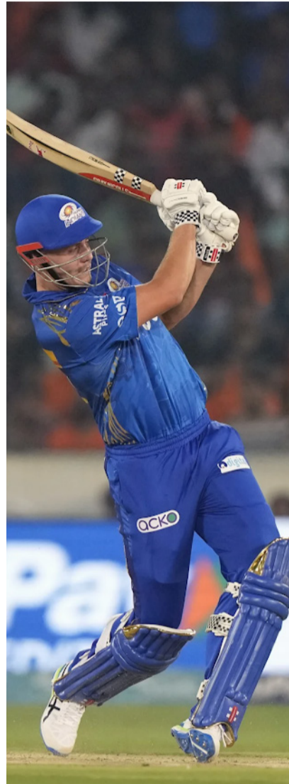
வித்தியாசத்தில் வெற்றிபெற்றது. சன்ரைசர்ஸ் அணி 178 ஓட்டங்களுக்கு அனைத்து விக்கெட்களையும் இழந்தது. மும்பை இந்தியன்ஸ் தரப்பில் சாவ்லா, பெஹ் ரன்டோர்ப், மெரிடித் தலா இரண்டு விக்கெட்களை

ஹைதராபாத், ஏப். 20 சன் ரைசர்ஸ் ஹைதராபாத் அணிக்கு எதிரான போட்டியில் மும்பை இந்தியன்ஸ் 14 ஓட்டங்கள் வித்தியாசத்தில் வெற்றிபெற்றது. 194 ஓட்டங்கள் இலக்கை துரத்திய சன் ரைசர்ஸ் அணிக்கு கடந்த போட்டியில் சதம் விளாசிய ஹாரி ப்ரூக் இம்முறை 2ஆவது ஓவரி லேயே விக்கெட்டை பறிகொடுத்தார். அவரை வீழ்த்திய ஜசன் பெஹ் ரன்டோர்ப் 4ஆவது ஓவரில் 7 ஓட்டங்கள் எடுத்திருந்த திரிபாதி யின் விக்கெட்டையும் எடுத்தார். எனினும் மயங்க அகர்வால் இம் முறை நிதானமாக விளையாடினார். அவருக்கு பக்கபலமாக சிறிது நேரம் தாக்குப்பிடித்தார் அணித் தலைவர் அய்டன் மார்க்ரம். 22 ஓட்டங்கள் எடுத்திருந்த மார்க்ரமை மும்பை வீரர் கிறீன் வெளியேற்ற, அபிஷேக் சர்மா வந்தே வேகத்தில் நடைபயக் கட்டினார். ஆனால், ஹென்றிச் கிளாசென் வந்ததும் அதி ரடியாக விளையாடினார். 16 பந்துகளில் 36 ஓட்டங்கள் சேர்த்திருந்த அவரை சாவ்லா வீழ்த்த, ஆரம்பம் முதல் நிலைத்திருந்த மயங்க அகர்வாலை 48 ஓட்டங்களில் இம்பேக்ட் வீரராக வந்த ரிலே மெரிடித் ஆட்டமிழக்க செய்தார். இதன்பின் வந்த நடுவரிசை வீரர்கள் பெரிதாக சோபிக்கவில்லை. கடைசி 6 பந்துகளுக்கு 20 ஓட்டங்கள் தேவைப்பட, அர்ஜுன் டெண்டுல்கர் பந்துவீசினார். ஓவரின் ஐந்தாவது பந்தில் புவனேஷ்வர் குமாரை ஆட்டமிழக்க செய்தார். ஜி. பி. எல். தொடரில் அர்ஜுன் எடுக்கும் முதல் விக்கெட் இதுவாகும். கடைசி ஓவரில் 5 ஓட்டங்கள் மட்டுமே விட்டுக்கொடுத்து ஒரு விக்கெட்டையும் வீழ்த்த மும்பை இந்தியன்ஸ் அணி 14 ஓட்டங்கள்