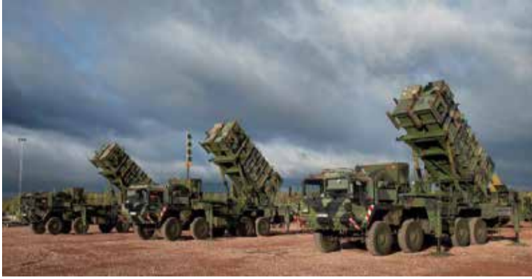
ஒரு பேட்ரியாட் பேட்டரி தாக்குதல் விமானங்கள், குருஸ் ஏவுகணைகள் மற்றும் சில பாலிஸ்டிக் ஏவுகணைகளை இலக்குகளைத் தாக்கும் முன்பே

பேட்ரியாட் ஏவுகணை பாதுகாப்பு அமைப்பை உக்ரைனுக்கு அனுப்புவதாக கடந்த ஆண்டு டிசம்பரில் அமெரிக்கா அறிவித்தது. இதை பயன்படுத்த விரிவான பயிற்சி தேவை என்பதால் சுமார் 100 உக்ரேனிய துருப்புக்கள் இந்த ஆண்டு ஜனவரியில் அமெரிக்காவில் பேட்ரியாட் ஏவுகணை பாதுகாப்பு அமைப்பில் பயிற்சி பெற்றனர்.