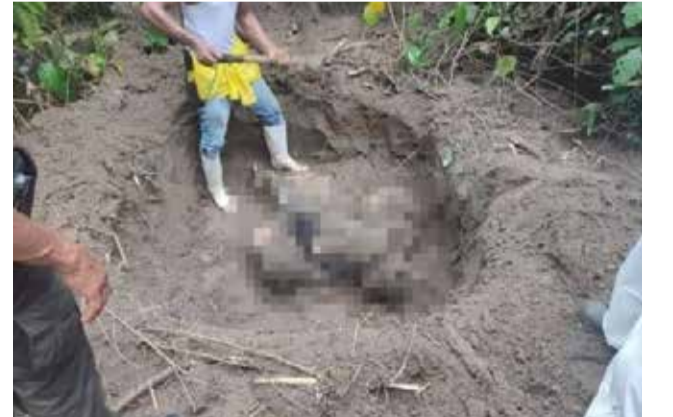
தெரியவில்லை. அருகில் உள்ள சி.சி.ரி.வி கமராக்களை பொலிஸார் ஆய்வு செய்து வருகின்றனர்.