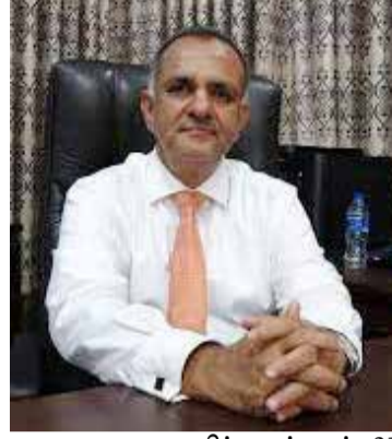
நிந்தவூர், ஏப். 21

“சகையின் சிறப்பை எடுத்தியம்பும் புனித ரமழான் மாதம் எம்மை விட்டுப்பிரிந்து செல்லும் நிலையில் ஈதல் பித்ர நோன்புப் பெருநாளைக் கொண்டாடும் சகல முஸ்லிம்களுக்கும் பெருநாள் வாழ்த்துக்களைத் தெரிவிப்பதில் பேருவகையடைகின்றேன்”