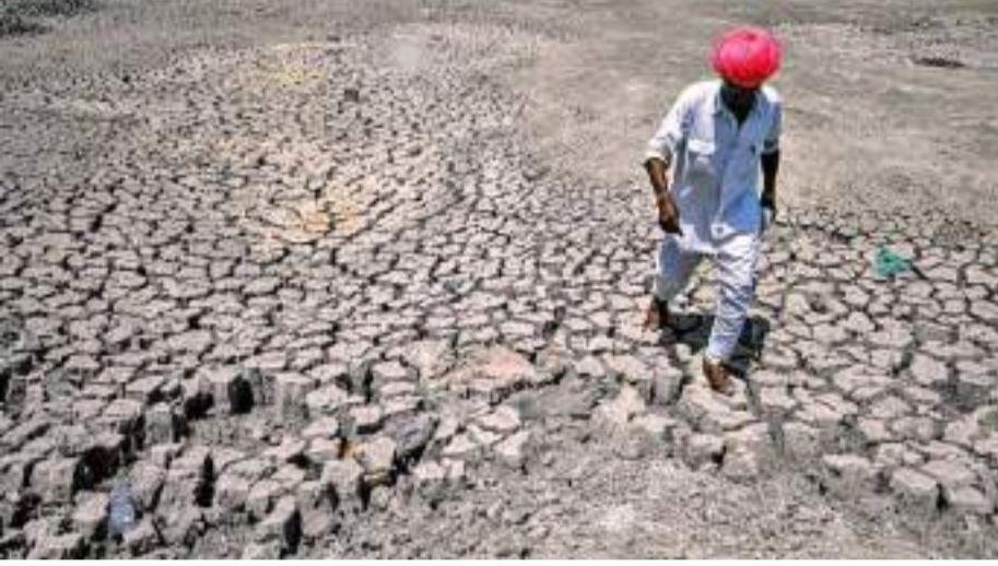
தொடர்ச்சியாக 45 பாகை செல்சியசுக்கு அதிகமாக வெப்பநிலை பதிவானாலும் வெப்பஅலை வீசுவதாக வானிலை மையம் எச்சரிக்கும். இந்தியாவில் கடந்த சில ஆண்டுகளாகவே வெப்ப அலைகள் பதிவாகி உயர்களை பறித்து வருகின்றன. இந்தியாவில், சுமார் 75% தொழிலாளர்கள் (சுமார் 380 மில்லியன் மக்கள்) வெப்பம் தொடர்பான மனஅழுத்தத்தை அனுபவிக்கின்றனர், இது

அக்னி நட்சத்திர காலம் பற்றி மக்கள் அச்சப்பட்டு வந்த நிலையில், வெப்ப அலைகள் பற்றி அடிக்கடி பேசப்படுகிறது. கடலில் அலைகள் எழுவதை பார்க்கும்போது, அது என்ன வெப்பஅலை என்ற சந்தேகம் பலருக்கும் எழக்கூடும். கோடை காலத்தில் சராசரியாக பதிவாகும் வெப்பநிலையை விட வழக்கத்திற்கு மாறாக அதிக அளவில் வெப்பம் பதிவாகும். இது இரண்டு அல்லது அதற்கு மேற்பட்ட நாட்கள் நீடிக்கும்.