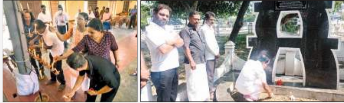
மட்டக்களப்பு விசேட நிருபர்