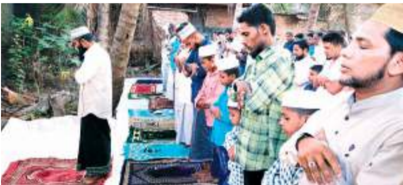
சர்வதேச பிறை அடிப்படையில் இடம்பெற்ற புனித ஈதல் பித்ர் நோன்புப் பெருநாள் தொழுகையும் சூப்பா பிரசங்கமும் நேற்று (21) வெள்ளிக்கிழமை கல்முனையில் இடம்பெற்ற போது...