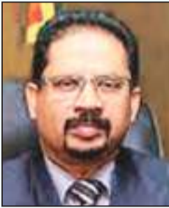
மொழிகளாகக் கருதப்படுவதாகவும் ஒரு நாடு என்ற வகையில் அரசு துறையில் மட்டுமன்றி, வேறு எந்தப் பணியிலும் சிங்களம் மற்றும் தமிழ் இரண்டும் பிரதான மொழிகளாகும் என்றும், அவர் மேலும் தெரிவித்துள்ளார்.

தொடர்பில் அரசாங்க தகவல் திணைக்களத்தில் (19) நடைபெற்ற விசேட செய்தியாளர் மாநாட்டில் கலந்துகொண்டு கருத்து தெரிவித்த போதே அவர் மேற்கண்டவாறு தெரிவித்துள்ளார். தமிழ் மற்றும் சிங்களம் இரண்டும் தேசிய மொழிகளாகக் கருதப்படுவதாகவும் ஒரு நாடு என்ற வகையில் அரசு துறையில் மட்டுமன்றி, வேறு எந்தப் பணியிலும் சிங்களம் மற்றும் தமிழ் இரண்டும் பிரதான மொழிகளாகும் என்றும், அவர் மேலும் தெரிவித்துள்ளார். பொது நிர்வாக, உள்நாட்டலுவல்கள், மாகாண சபைகள் மற்றும் உள்நாட்டு அமைச்சின் கீழ் அரசு கரும மொழிப் பாடத்தை கையாள்வதற்கான தனியான பிரிவொன்று இருப்பதாகவும் நாட்டின் அரசு கரும மொழிக் கொள்கையை அரசியலமைப்பில் உள்ளடக்கி அதற்கு அதி முக்கியத்துவம் வழங்குவதற்கு அரசியலமைப்பிலேயே ஏற்பாடுகள் செய்யப்பட்டுள்ளதாகவும், அவர் மேலும் தெரிவித்துள்ளார்.