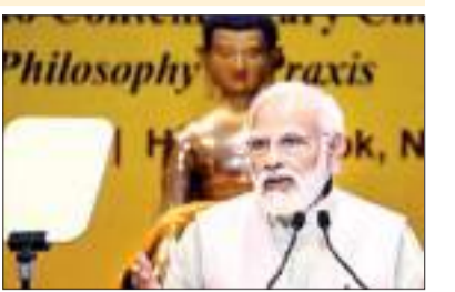
புத்தரின் இந்த உணர்வு நித்தியமானது மற்றும் நிலையானது" என்றும் மோடி தெரிவித்தார். நடைமுறையை நோக்கி தத்துவம் என்ற கருப்பொருளில் சர்வதேச பெளத்த உச்சி மாநாடு புது டெல்லியில் நடைபெற்று வருகிறது. சர்வதேச பெளத்த கூட்டமைப்புடன் இணைந்து இந்திய மத்திய அரசின் கலாசார அமைச்சகம் இந்த மாநாட்டை நடத்துகிறது.

புது டில்லியில் கடந்த வியாழக் கிழமை (20) ஆரம்பமான உலக பெளத்த உச்சமாநாட்டை ஆரம்பித்து வைத்து உரையாற்றிய இந்திய பிரதமர் நரேந்திர மோடி, கௌதம புத்தரின் உன்னத போதனைகளை குறிப்பிட்டுக் கூறினார். "கௌதம புத்தரின் உன்னத போதனைகள் பல நூற்றாண்டுகளாக எண்ணிலடங்காத மக்களை பாதித்துள்ளது. புத்தரின் போதனையில் கவந்த உலக நலன்புரிக்காக இந்தியா புதிய முயற்சிகளை மேற்கொண்டுள்ளது" என்று மோடி குறிப்பிட்டார். "ஒரு நபர் என்பதற்கு அப்பால் புத்தரை புரிதல் வேண்டும். புத்தர் என்பது வருவதற்கு அப்பாற்பட்ட ஒரு சிந்தனை. புத்தர் என்பது உருவத்திற்கு அப்பாற்பட்ட ஓர் உணர்வு.