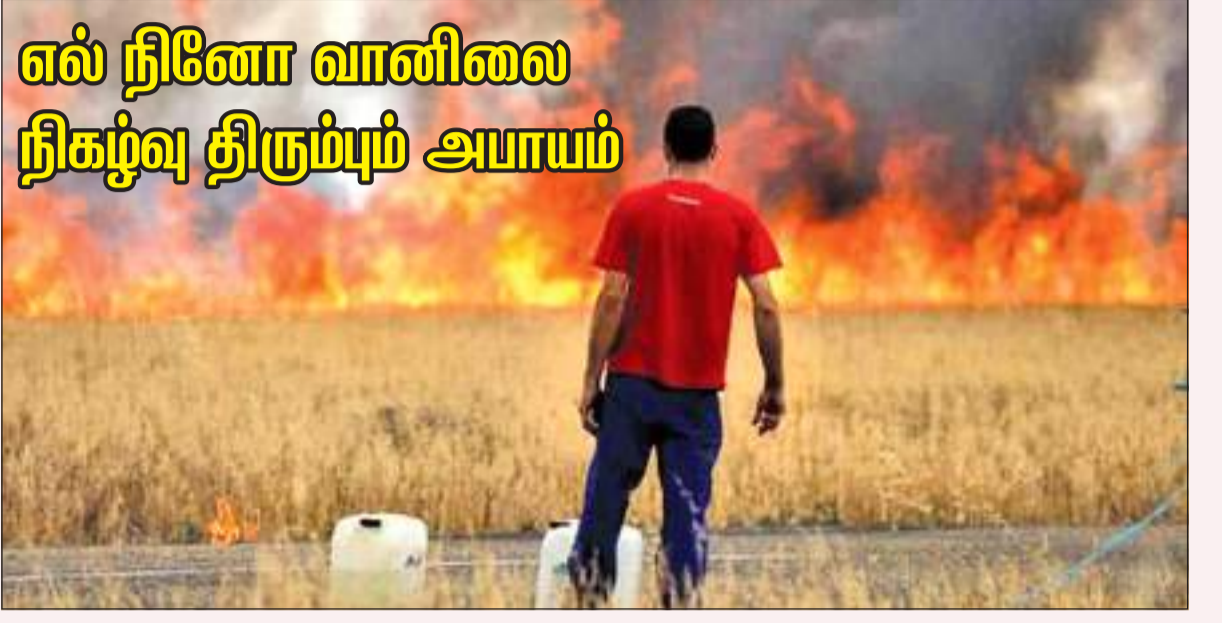
எல் நினோ வானிலை நிகழ்வு திரும்பும் அபாயம்

காலநிலை மாற்றம் மற்றும் எதிர்பார்க்கப்பட்ட எல் நினோ வானிலை நிகழ்வு காரணமாக 2023 அல்லது 2024இல் உலகின் சராசரி வெப்பநிலையில் அதிகரிப்பு ஏற்படலாம் என்று காலநிலை விஞ்ஞானிகள் குறிப்பிட்டுள்ளனர். உலக வெப்பநிலை சற்று குறைவாக இருந்த பசிபிக் பெருங் கடலில் எல் நினோ வானிலைப் போக்கின் மூன்று ஆண்டு நிகழ்வுக்குப் பின், இந்த ஆண்டு பிற்பகுதியில் அதன் எதிர்தலைவாக உள்ள வெப்பமான எல் நினோ போக்கு மீண்டும் திரும்புவது. எல் நினோவின்போது, பூமீதிய ரேகையில் மேற்கு நோக்கி வீசும் காற்று மெதுவாக வீசுவதோடு சூடான நீர் கிழக்குப் பக்கம் தள்ளப்பட்டு, வெப்பமான மேற்பரப்பு பெருங்கடலின் வெப்பநிலையை அதிகரிக்கிறது. "2022இல் ஐரோப்பாவில் வெப்பநிலை சாதனை அளவுக்கு அதிகரிப்பதற்கு எல் நினோ காரணமாக இருந்த அதே நேரம் காலநிலை மாற்றம் பாதித்ததால் கரும் மழையால் பயிர்களை வெள்ளத்தை உருவாக்கியதோடு ஆர்ஜிக் கடலில் பணிக்கட்டி அளவு சாதனை நிலைக்கு குறைந்தது. உலகின் சராசரி உலகளாவிய வெப்பநிலை தற்போது தொழில் புரட்சிக்கு முன்னர் விடவும் 1.2 பாகை அதிகம் உள்ளது. உலகின் பிரதான கரியமில் வாயு உமிழ்வு நாடுகள் அதனைக் குறைக்க உறுதி