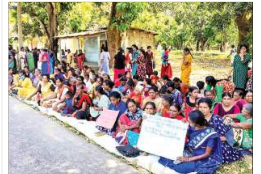
பாண்டிப்பு தினகரன் நிருபர்

அம்பாறை மாவட்டத்தின் நாவி தன்வெளி பிரதேச செயலகப் பிரிவினரின் 4 ஆம் கிராமத்தில் பயங்கர வாத எதிர்ப்பு சட்டத்திற்கு எதிர்ப்பு தெரிவித்து பெண்கள் அமைப்புக்க