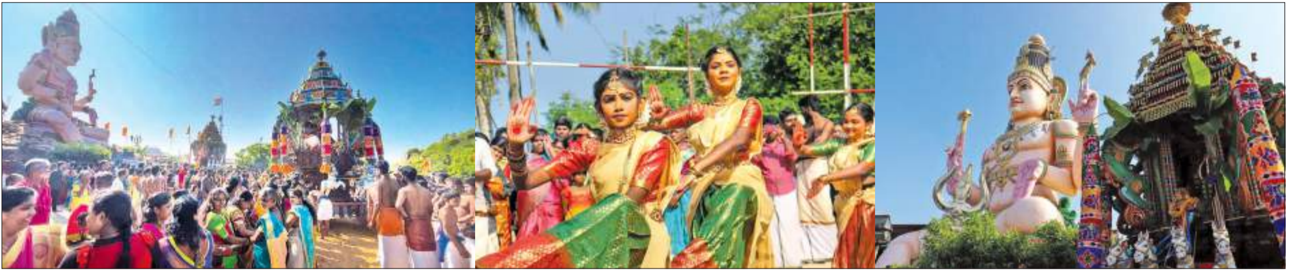
வரலாற்று சிறப்புமிக்க திருக்கோணேசர் ஆலய தேர் உற்சவம் நேற்று வெள்ளிக்கிழமை விமர்சயாக நடைபெற்றது. கோணேச பெருமான் மாதுமை அம்பாள் சமேதம் தேரில் ஆரோகித்து வீதி உலா வருவதைப் படத்தில் காணலாம்.