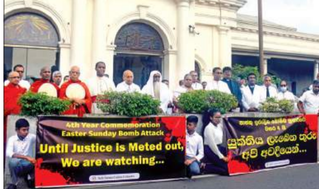
உயிர்த்த ரூபியு தின குணுத்தாக்குதல்கள் சம்பவத்தில் பலியானவர்களின் ஆன்ம இளைப்பாற்றுக்காக நாள்தோறும் நடைபெற்று கொண்டுள்ள நிகழ்வு நேற்று கொழும்பு கொச்சிக்கடை புனித அந்தோனியார் ஆலயத்தில் நடைபெற்றது. ரோபயர் கந்தினால் மெட்கம் ரஞ்சித் ஆண்ட்கையின் தலைமையில் தேவாலயத்துக்கு முன்பாக நடைபெற்ற மௌன அஞ்சலியின்போது பிடிக்கப்பட்ட படம்.