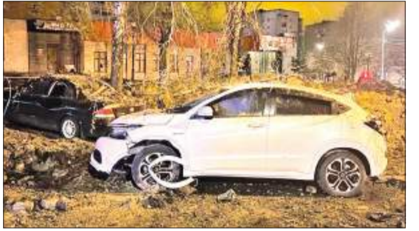
வெடிப்பு இடம்பெற்ற இடத்தில் இருந்து வெளியான புகைப்புகைகள் மற்றும் வீடியோக்கள் காண்பிக்கின்றன. 370,000 மக்கள் வசிக்கும் பெல் கொரோட் நகரம் உக்ரைன் எல்லையில் இருந்து சுமார் 40 கிலோமீட்டர் தூரத்தில் உள்ளது. அது உக்ரைனின் இரண்டாவது பெரிய நகரான கர்கிவில் இருந்து வடக்காக உள்ளது. கடந்த ஆண்டு உக்ரைன் மீதான ரஷ்யாவின் படையெடுப்பு தொடக்கம் இந்த நகரில் இருக்கும் மக்கள் உக்ரைனிய ஷெல் குண்டுகளுக்கு பயந்தே வாழ்ந்து வருகின்றனர். உக்ரைனை நோக்கி செல்லும் ரஷ்ய போர் விமானங்கள் இந்த நகருக்கு மேலாலேயே எப்போதும் பறந்து வருகின்றன.

ரஷ்ய போர் விமானம் ஒன்று உக்ரைன் நாட்டுக்கு அருகில் இருக்கும் தனது சொந்த நகரான பெல் கொரோட் மீது தவறுதலாக குண்டு போட்டுள்ளது. இந்த குண்டு வெடிப்பினால் நகர மத்தியில் சுமார் 20 மீட்டர் (60 அடி) அகலமான பாரிய பள்ளம் ஒன்று ஏற்பட்டிருப்பதாக ரஷ்ய பாதுகாப்பு அமைச்சு தெரிவித்துள்ளது. இரு பெண்கள் காயமடைந்து பல கட்டடங்களும் சேதமடைந்துள்ளன. எல்.யு-34 போர் விமானம் தவறுதலாக விமானத்தில் இருக்கும் ஆயுதத்தை விடுவதற்குப் பதிலாக அமைச்சு குறிப்பிட்டுள்ளது. இந்த சம்பவம் கடந்த வியாழக்கிழமை இடம்பெற்றிருப்பதாக ரஷ்ய செய்தி நிறுவனங்கள் தெரிவித்துள்ளன. இது தொடர்பில் விசாரணைகள் ஆரம்பிக்கப்பட்டிருப்பதாகவும் அந்த செய்திகள் கூறுகின்றன. வெடிப்பினால் குடியிருப்பு கட்டடங்கள் சேதமடைந்திருப்பதும் கட்டடத்தின் கூரை மீது கார் வண்டி ஒன்று வீசப்பட்டிருப்பதும்