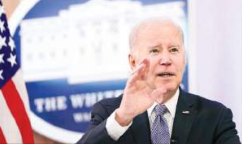
பட வாய்ப்பு இருப்பதாகவும் அந்த செய்தியில் சுட்டிக்காட்டப்பட்டுள்ளது. 80 வயதாகும் பைடன் ஏற்கனவே அமெரிக்காவின் மிக வயதான ஜனாதிபதியாக பதிவாகி இருப்பதோடு அவர் தனது இரண்டாவது தவணையை பூர்த்தி செய்யும் போது 86 வயதை எட்டி இருப்பார்.

அமெரிக்க ஜனாதிபதி ஜோ பைடன் நீண்ட காலம் எதிர்பார்க்கப்பட்ட இரண்டாவது தவணைக்காக போட்டியிடும் அறிவிப்பை அடுத்த மாதம் வெளியிடுவார் என்று எதிர்பார்ப்பதாக அந்நாட்டு ஊடகங்கள் குறிப்பிட்டுள்ளன. வீடியோ பதிவு ஒன்றின் மூலம் தான் மீண்டும் ஜனாதிபதி தேர்தலில் போட்டியிடும் அறிவிப்பை அவர் வெளியிட்டார் என்று சொன்ன கமரான வட்டாரங்களை மேற்கோள் காட்டி வெஷிங்டன் போஸ்ட், சி.என்.என் உட்பட அமெரிக்க ஊடகங்கள் செய்தி வெளியிட்டுள்ளன. பைடன் கடந்த முறை ஜனாதிபதி தேர்தலில் போட்டியிட்ட ஆண்டு நிறைவு தினமான எதிர்வரும் செவ்வாய்க்கிழமை இந்த அறிவிப்பு வெளியாகும் என்று எதிர்பார்ப்பதாக வெஷிங்டன் போஸ்ட் தெரிவித்துள்ளது. எனினும் இந்தத் திட்டம் இன்னும் இறுதி செய்யப்படவில்லை என்றும் பிற்போட்ப