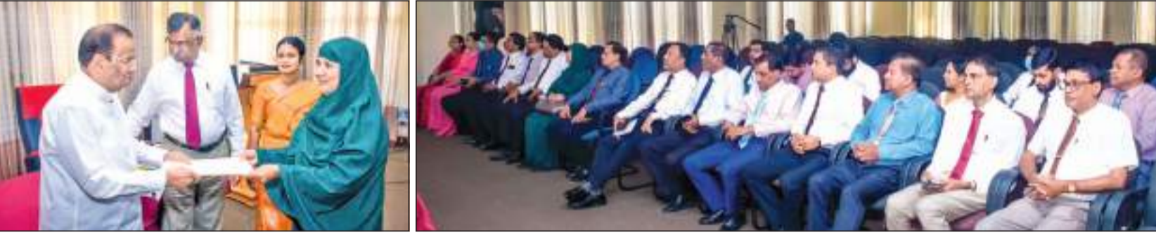
புதுளை தினகரன் விசேட நிருபர்