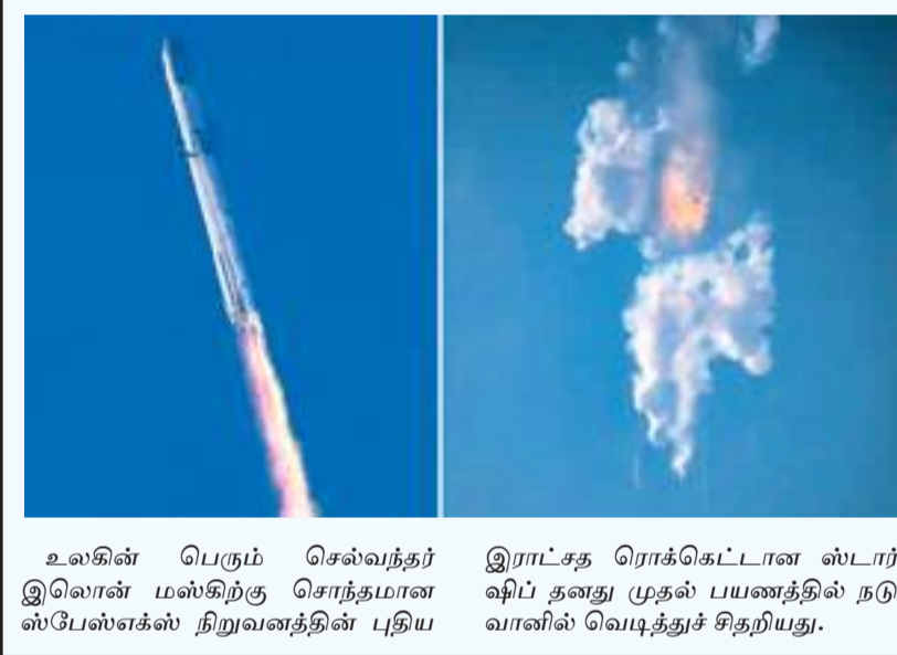
உலகின் பெரும் செல்வந்தர் இலான் மஸ்கிற்கு சொந்தமான ஸ்பேஸ்க்ஸ் நிறுவனத்தின் புதிய