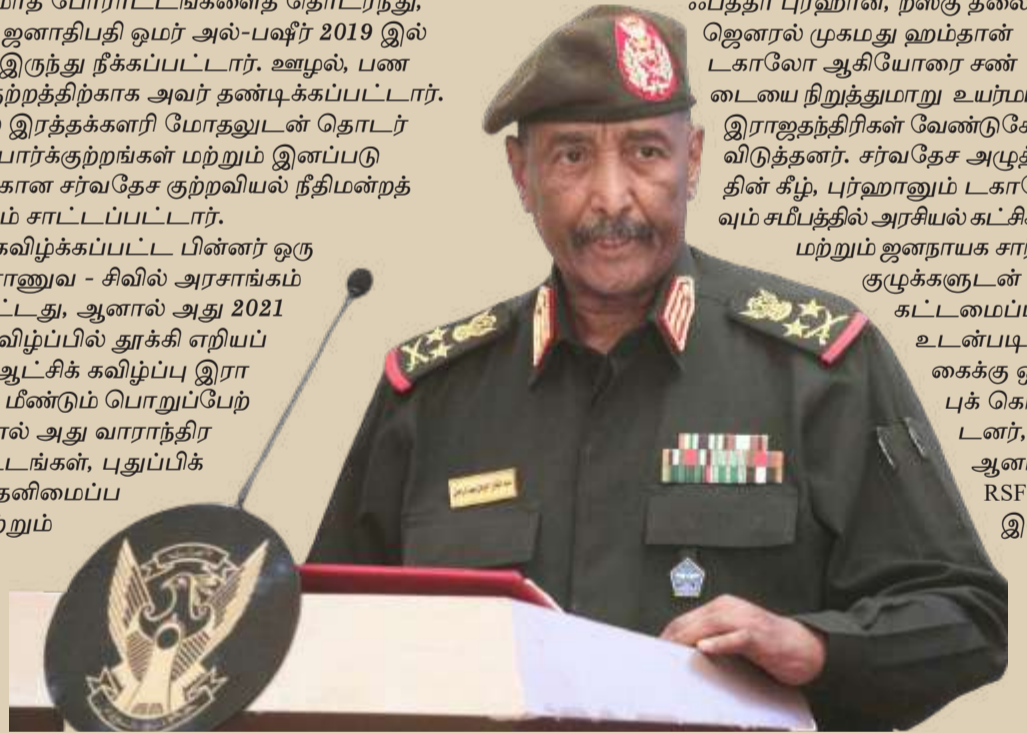
ஆயுதப் படைகள் மற்

ஆயுதப் படைத் தலைவர் ஜெனரல் அப்தெல்-ஃபத்தா புர்ஹான், ற்ஸ்கு தலைவர் ஜெனரல் முகமது ஹம்தான் டகாலோ ஆகியோரை சண்டையை நிறுத்துமாறு உயர்மட்ட இராஜதந்திரிகள் வேண்டுகோள் விடுத்தனர். சர்வதேச அழுத்தத்தின் கீழ், புர்ஹானும் டகாலோவும் சமீபத்தில் அரசியல் கட்சிகள் மற்றும் ஜனநாயக சார்புக் குழுக்களுடன் ஒரு கட்டமைப்பு உடன்படிக்கைக்கு ஒப்புக் கொண்டனர், ஆனால் இன்