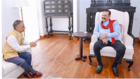
இலங்கைக்கும் இடையிலான இரு தரப்பு உறவுகளை மேலும் வலுப்படுத்துவதற்கான உறுதிப்பாட்டை மீண்டும் உறுதிப்படுத்தியது என முன்னாள் பிரதமர் மகிந்த ராஜபக்ச தெரிவித்துள்ளார். (அ)

கொழும்பு, ஏப். 22 முன்னாள் பிரதமர் மஹிந்த ராஜபக்சவை இலங்கைக்கான இந்திய தூதுவர் கோபால் பாக்கலே நேற்று முன்தினம் வியாழக்கிழமை சந்தித்து பேசியுள்ளார். இந்தச் சந்திப்பின்போது, இலங்கையுடனான கடன் மறுசீரமைப்புக்கு இந்தியாவின் ஆதரவு உள்ளிட்ட பரஸ்பர நலன்கள் குறித்து இருவரும் விவாதித்துள்ளனர். சர்வதேச நாணய நிதியம் இலங்கைக்கு வழங்கி வரும் ஆதரவுக்கு இந்தியா துணைநிற்பதாகவும் இந்திய தூதுவர் கோபால் பாக்கலே உறுதியளித்துள்ளார். மேலும், இலங்கையில் இந்திய முதலீடுகள் குறித்தும் இருவரும் கலந்துரையாடியுள்ளனர். நட்பு ரீதியிலும் சுமுகமான சூழ்நிலையிலும் நடைபெற்ற இந்தச் சந்திப்பு, இந்தியாவுக்கும்