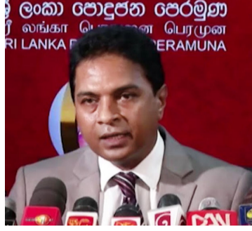
சாங்கம்தான். எதிர்காலத்தில் திட்டமிட்ட கலந்துரையாடல்கள் மூலம் ஒரு தேசிய அரசாங்கம் அமைக்கப்படும் பட்சத்தில் மொட்டுக் கட்சி நிபந்தனையற்ற ஆதரவு வழங்கும்-என்றார். (அ)

தற்போதுள்ள அரசாங்கத்தில் மொட்டுக் கட்சியைச் சேர்ந்த 4 அமைச்சர்கள் உள்ளனர். ஐக்கிய மக்கள் சக்தி அமைச்சர்கள் இருவர் உள்ளனர். ஸ்ரீ லங்கா சுதந்திரக் கட்சி அமைச்சர்கள் இருவர் உள்ளனர். ஏனைய கட்சிகளைச் சேர்ந்தவர்களும் அமைச்சர்களாக உள்ளனர். அதுமட்டுமல்லாமல் ஒரு தேசிய அரசு