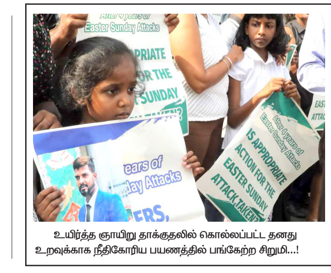
உயிர்த்த ஞாயிறு தாக்குதலில் கொல்லப்பட்ட தனது உறவுக்காக நீதிகோரிய பயணத்தில் பங்கேற்ற சிறுமி...!

சிறீ லங்கா சுதந்திர கட்சி கொழும்பு, ஏப். 22 சர்வகட்சி அரசாங்கம் அமைக்கப்பட்டால் அதில் நாம் பங்கேற்போம். அதனை விடுத்து தேசிய அரசாங்கம் என்ற பெயரில் அமைச்சரவை அமைச்சுகளின் எண்ணிக்கையை அதிகரிப்பதற்கும் இராஜாங்க மற்றும் பிரதி அமைச்சர்களை நியமிப்பதற்கும் துணை போக முடியாது என்று சிறீ லங்கா