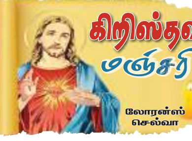
கிறிஸ்தவ மனச்சரீ லோரன்ஸ் செல்வா