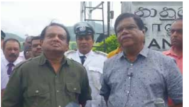
கொழும்பு வரை மரக்கறிகளை கொண்டுவருவதற்கு நானுஓயா ரயில் நிலையத்தை மையப்படுத்தி பொருளாதார மற்றும் நிதியை அலைபேசி ஒன்று அமைக்கப்படும் என அமைச்சர் குறிப்பிட்டார். அதேவேளை, நானுஓயா ரயில் நிலையத்துக்கு வருகை தந்திருந்த அமைச்சர், நானுஓயா ரயில் நிலையத்தில் இருந்து எல்லாவற்றைச் சேர்ந்த கார்த்திருநத்த வெளிநாட்டு சுற்றுலா பயணிகளுடன் கலந்துரையாடினார்.

நானுஓயா ரயில் நிலையத்திலிருந்து நுவரெலியா மற்றும் ராகலை வரை பயணிக்கக்கூடிய புதிய ரயில் பாதை வெகுவிசைவில் நிர்மாணிக்கப்படும் என்று போக்குவரத்து அமைச்சர் பந்துல உத்தரவிட்டார். நுவரெலியா, நானுஓயா பகுதிக்கு கண்காணிப்புப் பணம் மொன்றை மேற்கொண்டிருந்த பின்னர், ஊடகங்களுக்கு கருத்து வெளியிடும் போதே அமைச்சர் இந்த தகவலை வெளியிட்டார். 'நுவரெலியா நகருக்கு வரும் உள்நாட்டு மற்றும் வெளிநாட்டு சுற்றுலா பயணிகள் ரயில் சேவை தேவையாக உள்ளது. எனவே, மத்திய மாகாண ஆளுநர் காலத்தில் செயற்பட்ட நுவரெலியா - கந்தபளை ரயில் நிலையத்துக்கு இடையில் ரயில் சேவையை மீள் ஆரம்பிக்க நடவடிக்கை எடுக்கப்படும். இதற்காக புதிய ரயில் பாதையும் நிர்மாணிக்கப்படும். நுவரெலியாவில் இருந்து கொழும்பு வரை மரக்கறிகளை கொண்டுவருவதற்கு நானுஓயா ரயில் நிலையத்தை மையப்படுத்தி பொருளாதார மற்றும் நிதியை அலைபேசி ஒன்று அமைக்கப்படும்' என அமைச்சர் குறிப்பிட்டார். அதேவேளை, நானுஓயா ரயில் நிலையத்துக்கு வருகை தந்திருந்த அமைச்சர், நானுஓயா ரயில் நிலையத்தில் இருந்து எல்லாவற்றைச் சேர்ந்த கார்த்திருநத்த வெளிநாட்டு சுற்றுலா பயணிகளுடன் கலந்துரையாடினார்.