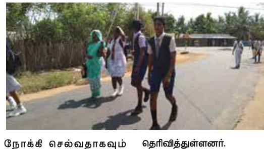
நோக்கி செல்வதாகவும் தெரிவித்துள்ளனர்.

இருக்கின்றனர். எனவே மாணவர்களின் நலன்கருதி ஓர் பேருந்துகளை சம்பந்தப்பட்ட அதிகாரிகள் ஏற்படுத்தித் தர வேண்டும் என பாதிக்கப்பட்டவர்களின் பெற்றோர்கள் கோருகின்றனர். அத்துடன் மேலும் தெரிவிக்கையில் தமது பகுதியில்காலை மாத்திரமே தனியார் பேருந்து ஒன்று சேவையில் கல்லாறு பகுதியிலிருந்து கிளிநொச்சி