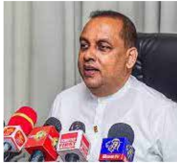
ரூபாவுக்கும் வழங்கப்படவுள்ளது. ஏனைய உரங்களின் விலையை 4500 ரூபாவால் குறைப்பது தொடர்பிலும் நடவடிக்கை எடுக்கப்பட்டுள்ளதாக விவசாய அமைச்சர் மஹிந்த அமரவீர மேலும் தெரிவித்துள்ளார்.

நெற்செய்கையில் ஈடுபடும் விவசாயிகளுக்கு உரத்தைக் கொள்வனவு செய்வதற்கான நிதிமானியம் வழங்குவது தொடர்பில் அரசாங்கம் கவனம் செலுத்தியுள்ளதாக விவசாய அமைச்சர் மஹிந்த அமரவீர தெரிவித்துள்ளார். விவசாயிகளின் உற்பத்தி செலவைக் குறைப்பதற்காகவே இந்த நிதிமானியம் வழங்கப்படவுள்ளது. அதற்கமைய ஒரு ஹெக்டேயரில் நெற் செய்கையை முன்னெடுக்கும் விவசாயிகளுக்கு 20 ஆயிரம் ரூபாவும், இரு ஹெக்டேயருக்கு 40 ஆயிரம் ரூபாவும் வழங்குவதற்கு ஜனாதிபதி தீர்மானித்துள்ளார். அதற்கமைய 5 லட்சத்து 50 ஆயிரம் விவசாயிகளுக்கு இந்த நிதிமானியத்தை வழங்குவதற்காக 11 பில்லியன் ரூபா ஒதுக்கப்பட்டுள்ளது. விவசாயிகளுக்கு தேவையான இலவசமாக வழங்கப்பட்டுள்ளதோடு யூரியா உர மூலையொன்று 10 ஆயிரம்