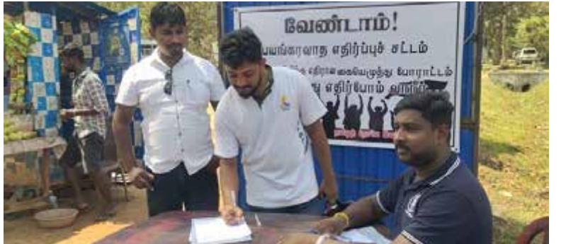
திரட்டும் நடவடிக்கையில் மக்கள் பலரும் கலந்து கொண்டு கையொப்பமிட்டனர். மேற்படி கையொப்பப் பிரதிகளானவை, அனைத்து நாடாளுமன்ற உறுப்பினர்கள் மற்றும் ஐக்கிய நாடுகள் மனித உரிமை பேரவைக்கும் அனுப்பிவைக்கப்பட உள்ளதாக ஏற்பாட்டாளர்கள் தெரிவித்தனர்.

தமிழ்த் தேசிய இளைஞர் பேரவையின் ஏற்பாட்டில் பயங்கரவாத எதிர்ப்புச் சட்டத்துக்கு எதிரான கையொப்பம் திரட்டும் நடவடிக்கை குடியிருக்கிற முன்னெடுக்கப்பட்டது. இந்த வேலைத்திட்டம் காலையில் கிளிநொச்சி சேவைச்சந்தை பிரதான வாயிலில் இடம்பெற்றது. கையொப்பத்து