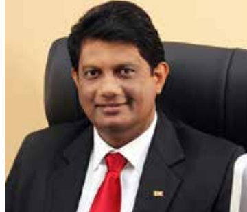
பலவீனப்படுத்தும் செயற்பாடுகள் மாத்திரம் மேற்கொள்ளப்படுகின்றன. சுதந்திர மக்கள் சபை அல்லது சுதந்திர மக்கள் கூட்டணியின் உறுப்பினர்கள் எவரும் தேசிய அரசாங்கத்தில் இணையப் போவதில்லை. ஸ்ரீலங்கா சுதந்திர கட்சிக்கு தேசிய அரசாங்கத்தில் இணைய வேண்டிய தேவை உள்ளது. ஆகவே, சுதந்திர கட்சியினர் ஒருவேளை தேசிய அரசாங்கத்தில் ஒன்றிணையலாம். - என்றார்.

விசேட வைத்திய நிபுணர் விடுமுறையில் இருப்பதால் இதுவரை பிரேத பரிசோதனை செய்யப்படவில்லை எனவும் அதனால் மாணவியின் உடல் உறவினர்களிடம் இன்னும் கையளிக்கப்படவில்லை எனவும் கூறப்படுகிறது. இது இவ்வாறிருக்க, கடந்த மூன்று வாரங்களுக்கு முன்னர் அப்பகுதியில் உள்ள பாலமொன்றுக்கு அருகில் மரமான முறையில் உயிரிழந்த 24 வயதுள்ள இளம் பெண்ணொருவரின் சடலமும் மீட்கப்பட்டிருந்தது. அப்பிரதேசத்தில் தொடர்ந்து இதுபோன்ற உயிரிழப்புகள் பிரேத பரிசோதனை செய்து அறிக்கையை சமர்ப்பிக்கு மாறு உத்தரவிட்டுள்ளார். இந்நிலையில், இதுவரை யாரும் கைது செய்யப்படவில்லை என பது குறிப்பிடத்தக்கது.