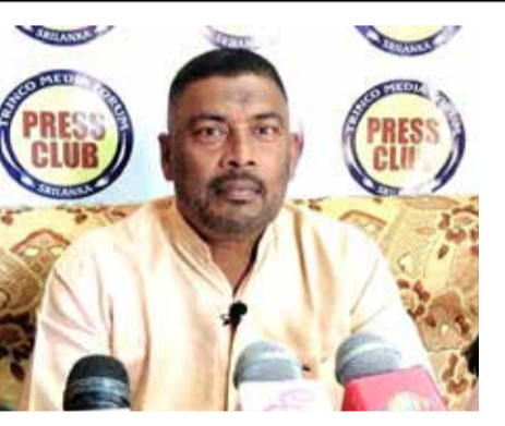
கொண்டதாக இருக்கக் கூடாது. கடந்த காலங்களிலே முஸ்லிம், தமிழ் சமூகமும் அரசியல் எதிரிகளும், சிறுபான்மை தலைமைகளும் பயங்கரவாத தடை சட்டம் என்ற ஒன்றால் அநியாயமாக

நாட்டிற்கான சட்டம் என்பது அனைத்து இன மக்களுக்கும் சமமாக பயன்படுத்தப்பட வேண்டுமே தவிர அது சிறுபான்மை சமூகத்தையும் எதிர் கட்சி அரசியல் தரம் பினரையும் அடக்கி, நசுக்குகின்ற தன்மை