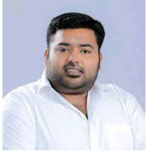
புது அவசியமான விடயம். அந்தவகையில் எமது சனத்தொகையை அதிகரிக்க வேண்டியது அனைவரது பொறுப்பு.

அனுபவிக்கும் சுகபோகங்களை தமது தாயக மக்களும் அனுபவிக்க வேண்டும் என்பதே புலம்பெயர் உறவுகளின் நோக்கம். அந்தவகையில் வரணி ஒன்றியம் பல உதவித்திட்டங்களை வழங்கி வரணி பிரதேசத்தை அபிவிருத்தி செய்து வருகின்றனர். எதிர்காலத்தில் அவர்கள் வரணியில் பிறக்கவுள்ள குழந்தைகளுக்கு ஒரு உதவு தொகையை வழங்கி குழந்தைப் பேற்றினை ஊக்குவிக்கவிருப்பதாக தெரிவித்துள்ளனர். இது மிகவும் அவசியமானதொரு விடயம். எமது சனத்தொகை வெகுவாக குறைவடைந்து வருகின்றது. 70-75 வருடங்களாக எமது உரிமைகளுக்காக போராடிக்கொண்டு இருக்கிறோம். இறுதியில் உரிமை கிடைக்கும் போது அதனை அனுபவிக்க யார் இருப்பது என்