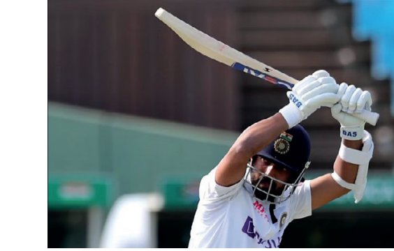
உலக டெஸ்ட் சம்பியன்ஷிப் இறுதிப் போட்டிக்கு

36 (22), இமாட் வஸீம் 31 (14) ஓட்டங்களைப் பெற்றனர். பந்துவீச்சில், பிளையர் டிக்கன் 4-0-33-3, இஷ் சோதி 4-0-21-1, அடம் மில்ன் 4-0-31-0 என்ற பெறுதிகளைக் கொண்டிருந்தனர். பதிலுக்கு 194 ஓட்டங்களை வென்றதோடு, வெற்றியிலக்காகக் கொண்டு துடுப்பெடுத்தாடிய நியூசிலாந்து, 19.2 ஓவர்களில் 4 விக்ரெட்டுகளை இழந்த நிலையில் வெற்றியிலக்கையடைந்தது. துடுப்பாட்டத்தில், மார்க் சம்மன் ஆட்டமிழக்காமல் 104 (57), ஜேம்ஸ் நீஷம் ஆட்டமிழக்காமல் 45 (25) ஓட்டங்களைப் பெற்றனர். பந்துவீச்சில், இமாட் வஸீம் 4-0-21-2 என்ற பெறுதிகளைக் கொண்டிருந்தார். இப்போட்டியின் நாயகனாகவும், தொடரின் நாயகனாகவும் மார்க் சம்மன் தெரிவானார்.