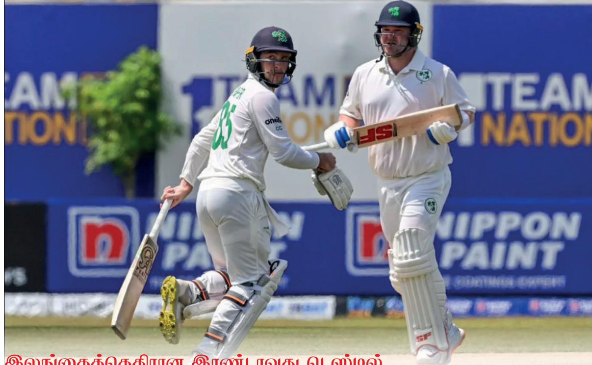
இலங்கைக்கெதிரான இரண்டாவது டெஸ்டில்

தங்கள் வீடுகளில் இருந்து உடனடியாக வெளியேறினர். எனினும், இரண்டு மணி நேரத்தில் சுனாமி எச்சரிக்கை வாய்ப்பு பெறப்படவில்லை.