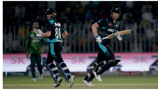
ஐந்தாவது இருபதுக்கு 20 சர்வதேசப் போட்டியில்

முதலாவது இனிங்ஸில் சகல விக்ரெட்டுகளையும் இழந்து 492 ஓட்டங்களைப் பெற்றது. பந்துவீச்சில், பிரபாத் ஜெயகுரியா 5, அசித் பெர்ணாண்டோ, விஷ்வ பெர்ணாண்டோ ஆகியோர் தலா 2 விக்ரெட்டுகளையும், ரமேஷ் மென்டிஸ் ஒரு விக்ரெட்டையும் வீழ்த்தினர்.