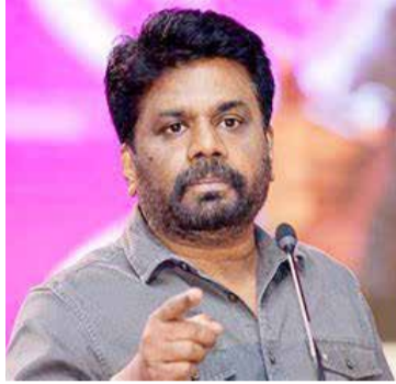
பித்துள்ளதாக அவர் குறிப்பிட்டார்.

கொழும்பு, ஏப். 27 கற்பனை உலகத்தில் இருந்து கொண்டு, ஜனாதிபதி ரணில் விக்கிரமசிங்க கருத்துக்களை வெளியிட்டுவருவதாக மக்கள் விடுதலை முன்னணியின் தலைவரும் பாராளுமன்ற உறுப்பினருமான அனுரகுமார திலாநாயக்க சபையில் தெரிவித்தார். தற்போது ரணில் விக்கிரமசிங்கவின் கற்பனை உலகத்துக்கும், களத்தில் நிற்கின்ற மக்களின் நிஜ வாழ்க்கைக்குமான மோதலையே ஜனாதிபதி ஆரம்