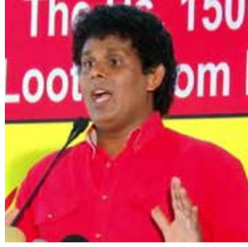
வனங்களால் அரசுக்கு - இந்த நாட்டு மக்களுக்கு ஏற்பட்ட நம்மை என்ன?-என்றார்.

இப்படி எல்லா வீழ்ச்சிக்கும் ஆட்சியாளர்களே காரணம். இதுவரை விற்கப்பட்ட நிறு