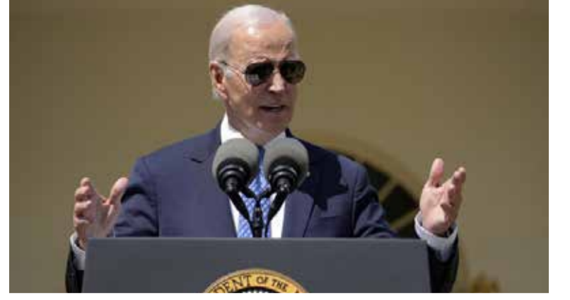
அனுப்புகின்றன. இந்த நடவடிக்கை மோதலின் ஆபத்தான விரிவாக்கம் என்று ரஷ்யா விவரித்துள்ளது. (அ)