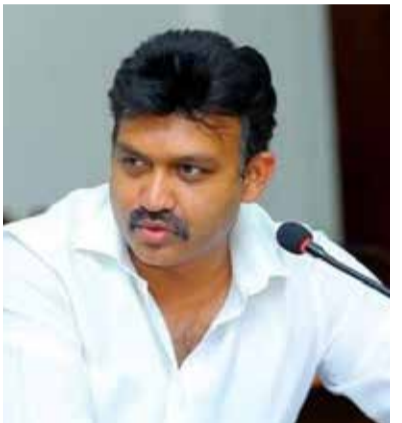
ஆளுநர்கள் நியமிக்கப்படவுள்ளனர். எனினும், தென் மற்றும் சப்ரகமுவ மாகாணங்களில் தற்போது ஆளுநர் பதவி வகிப்பவர்கள் அப்பதவியில் நீடிப்பார்கள் என தெரியவருகின்றது.

கொழும்பு, ஏப். 27 ஆளுநர் பதவிகளில் மாற்றத்தை ஏற்படுத்துவதற்கு உத்தேசித்துள்ள ஜனாதிபதி ரணில் விக்கிரமசிங்க எதிர்வரும் மே 2 ஆம் திகதி புதிய ஆளுநர்கள் சிலரை நியமிக்கவுள்ளார் என தெரியவருகின்றது. இதன்படி கிழக்கு மாகாண ஆளுநராக இலங்கை தொழிலாளர் காங்கிரஸின் தலைவர் செந்தில் தொண்டமான் நியமிக்கப்படவுள்ளார் என அறியமுடிகின்றது. மத்திய மாகாண ஆளுநர் பதவி முன்னாள் அமைச்சர் நவீன் திலாநாயக்கவுக்கு வழங்கப்படவுள்ளது. அதன் பின்னர் ஏனைய மாகாணங்களுக்கான புதிய