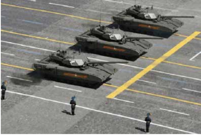
அறிக்கைகள் தெரிவிக்கின்றன. நேட்டோ நாடுகள் டிசின் கணக்கான அதிநவீன போர் டாங்கிகளை உக்ரைனுக்கு

ரி-14 முதன்முதலில் 2015 இல் வெளியிடப்பட்டது. கிரெம்லின் 2020 க்குள் 2,300 டாங்கிகளை உற்பத்தி செய்ய உத்தரவிட்டது. ஆனால் இது பின்னர் 2025 வரை நீட்டிக்கப்பட்டது என்று ரஷ்ய ஊடக