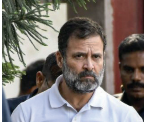
23ஆம் திகதி ராகுல் காந்தி குற்றவாளி எனத் தீர்ப்பளித்த நீதிமன்றம் அவருக்கு 2 ஆண்டுகள் சிறைத் தண்டனை விதித்து தீர்ப்பளித்தது.

இந்த வழக்கில் 4 ஆண்டு கால விசாரணைக்குப் பின்னர், கடந்த மாதம்