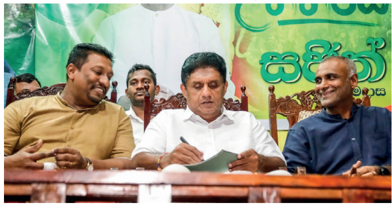
போதே எதிர்க்கட்சித் தலைவர் சஜித் பிரேமதாஸ இவ்வாறு தெரிவித்தார். தொடர்ச்சி P2

தற்போதைய அரசாங்கம், பயங்கரவாத எதிர்ப்புச் சட்டமூலத்தை முன்வைத்து, துன்பப்படும் மக்கள் தமது கோரிக்கைகளுக்காக குரல் எழுப்பும் போது, அவர்களை பயங்கரவாதிகள் என்று முத்திரை குத்தி, மனித உரிமைகளை நசுக்கி வருவதாகவும் எதிர்க்கட்சித் தலைவர் தெரிவித்தார்.