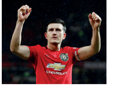
கூறியுள்ளதாக வெளியேற்றுவதில் பாரபட்சம் குறிப்பிடப்படுகிறது.

இங்கிலாந்து பிரீமியர் லீக் கால்பந்தாட்டக் கழகமான மன்செஸ்டர் யுனாட்டெட்டின் அணித்தலைவரான ஹரி மக்ருவாயாவை நடப்பு பருவகால முடிவில் அக்கழகம் விற்கும் எனத் தெரிகிறது. யுனாட்டெட்டின் முகாமையாளரான எரிக் டென் ஹக், குழாமமை வெளியேற்றுவதில் பாரபட்சம் பார்க்க வேண்டாமெனக்