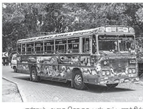
என்றும் அரை சொசூரி பஸ் கட்டணத்தில் விசேட பஸ்கள் சேவையில் சேர்க்கப்படும் என்றும் அவர் உறுதிப்படுத்தியுள்ளார்.

தமிழ் மற்றும் சிங்கள புத்தாண்டு விடுமுறைக் காலத்தில் கொடும்பிட்டு இருந்து வெளியூர் கருக்கு செல்லும் பயணிகளை ஏற்றிச் செல்வதற்காக மேலதிக பஸ்களை சேவையில் ஈடுபடுத்த தனியார் பஸ் உரிமையாளர்கள் தீர்மானித்துள்ளனர். ஏப்ரல் 10ஆம் திகதி முதல் விசேட பஸ்கள் சேவையில் ஈடுபடுத்தப்படும் என இலங்கை தனியார் பஸ் உரிமையாளர்கள் சங்கத்தின் தலைவர் தெரிவித்துள்ளார். தேவையில் அடிப்படையில் பஸ்வேறு இடங்களுக்கு மேலதிக பஸ்கள் இயக்கப்படும் என்றும் அரை சொசூரி பஸ் கட்டணத்தில் விசேட பஸ்கள் சேவையில் சேர்க்கப்படும் என்றும் அவர் உறுதிப்படுத்தியுள்ளார்.