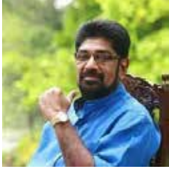
ஹக்கீம் கேட்ட கேள்விக்கு பதிலளிக்கும்போது அவர் மேற்கண்டவாறு குறிப்பிட்டார்.

கொரோனா தொடர்பான ஜனாதிபதி செயலணி நிபுணர் குழு பிழையாக வழிநடத்தப்பட்டிருப்பதுடன் நிபுணர் குழுவின் ஒரு சிலர் மக்களைப் பிழையாக வழிநடத்தியுள்ளதை ஏற்றுக்கொள்ளவில்லை என்று சுகாதார அமைச்சர் கெஹலியரம்புகுவெல தெரிவித்தார். நாடாளுமன்றத்தில் நேற்றையதினம் வாய்ப்புல விடைக்கான கேள்வி நேரத்தின்போது ஸ்ரீலங்கா முஸ்லிம்காங்கிரஸ்தலைவர் ரவீயுப்