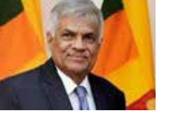
தங்கள் பாதுகாப்பை பலப்படுத்துவதற்காக

ஜனாதிபதி ரணில் தெரிவிப்பு பாதுகாப்பை பலப்படுத்த சீனா, இந்தியா, ஜப்பான், அவுஸ்திரேலியா 100 பில்லியன் டொலர்களை செலவிட திட்டம் இந்து - பசுபிக் பிராந்தியத்தில் பதற்றமான சூழ்நிலை உருவாகி வருவதோடு, அமெரிக்கா, சீனா, இந்தியா, ஜப்பான், அவுஸ்திரேலியா போன்ற நாடுகள் தமது விமானங்கள் மற்றும் போக்குவரத்துக் கப்பல்களைப் பயன்படுத்தி தங்கள் பாதுகாப்பை பலப்படுத்துவதற்காக