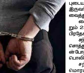
களை முன்னெடுத்திருந்தனர். இந்நிலையில் அதனுடன் தொடர்

மொரட்டுவ பொலிஸ் பிரிவுக்கு உட்பட்ட பகுதியில் பெண்ணொருவரிடமிருந்து பணப்பை உள்ளிட்ட சொத்துகளை கொள்ளையிட்டுச் சென்ற சம்பவத்தின் தொடர்புடைய இருவர் விடயங்களுக்கு மூன்று கைது செய்யப்பட்டுள்ளார்கள். முன்னதாக, மொரட்டுவ பகுதியில் முச்சக்கரவண்டியொன்றில் பயணித்துக்கொண்டிருந்த பெண்ணொருவரின் பணப்பைகளை உடன்பெற்றுத் தொலைபேசி உள்ளிட்ட சொத்துகளை கொள்ளையிட்டுச் சென்ற சம்பவம் தொடர்பில் பொலிஸார் விசாரணை