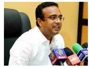
இணையத்தளத்தில் வேலை தேடும் மற்றும் இந்த ஆண்டு

கொரிய நாட்டில் வருடமொன்றுக்கு கிடைக்கப் பெறும் வேலைவாய்ப்புகளின் எண்ணிக்கையை அதிகரிப்பதற்கான நடவடிக்கைகள் முன்னெடுக்கப்பட்டு வருவதாகவும், தற்போது கிடைக்கப் பெறும் 6,500 வேலை வாய்ப்பு எண்ணிக்கையை 8,000 ஆக அதிகரிப்பதற்கான தீர்மானம் எட்டப்பட்டுள்ளதாக வெளிநாட்டு வேலை வாய்ப்பு அமைச்சர் மனுஷ நாணயக்கார தெரிவித்தார். கொரிய நாட்டு மனித வள திணைக்களத்தின் பணிப்பாளர் மற்றும் அமைச்சர் மனு நாணயக்கார ஆசிரியருக்கிடையில் நடைபெற்ற கலந்துரையாடலின் போது இந்தத் தீர்மானம் எடுக்கப்பட்டுள்ளதாகக் குறிப்பிடப்படுகின்றது. கொரிய மொழித் தேர்ச்சி பெற்று தற்போது