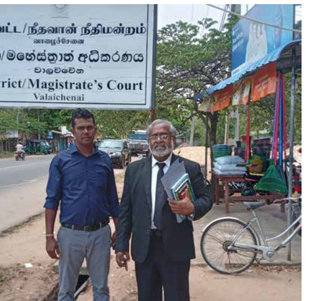
தடுத்து வைக்கப்பட்டிருந்தார். பின்னர் 07.03.2022 ஆம் திகதியன்று நிபந்தனையின் அடிப்படையில் விடுதலை செய்யப்பட்டிருந்தார். இருந்தபோதிலும் இவரது வழக்கு