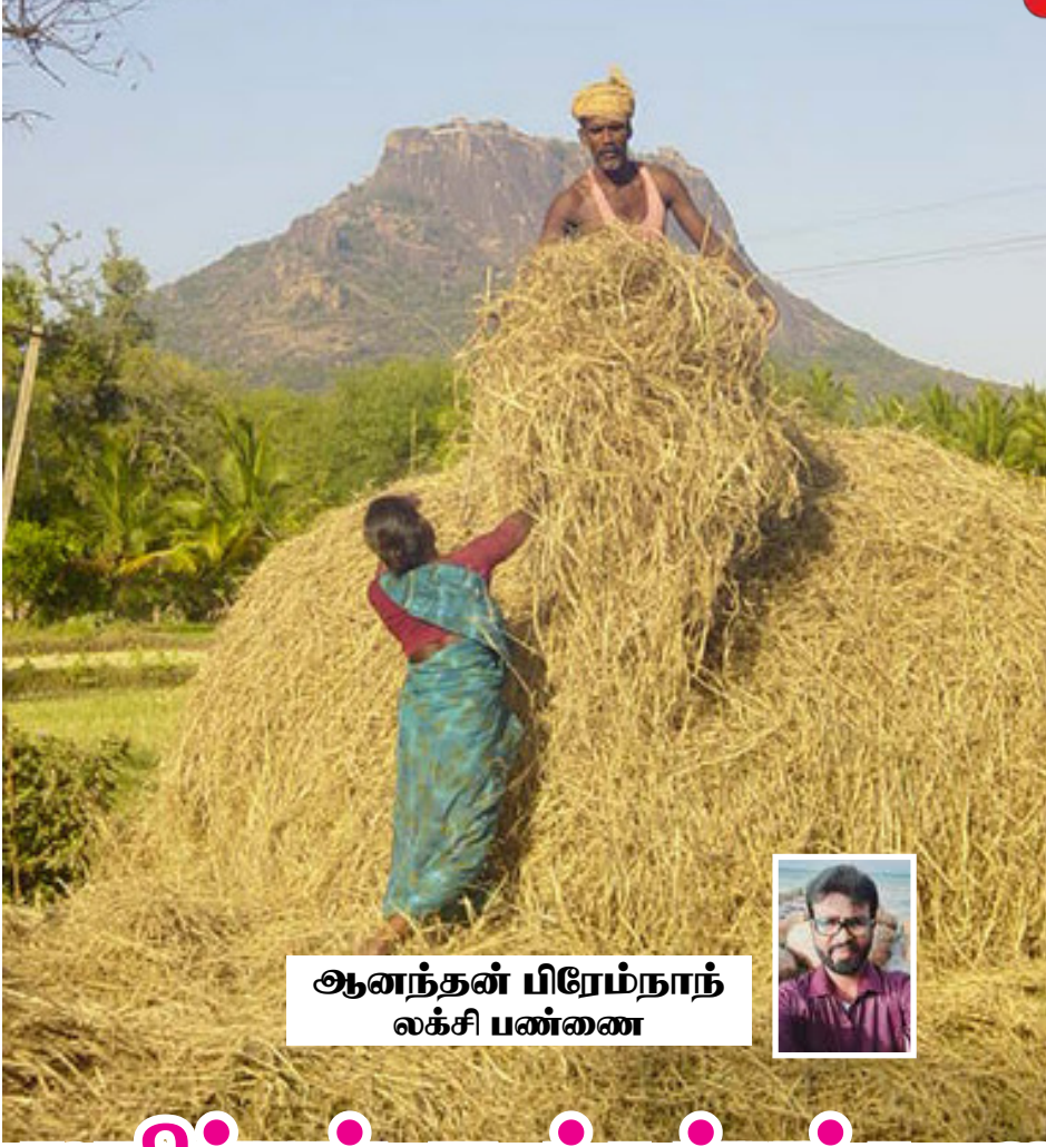
ஆனந்தன் பிரேம்நாந் லக்ஷி பண்ணை