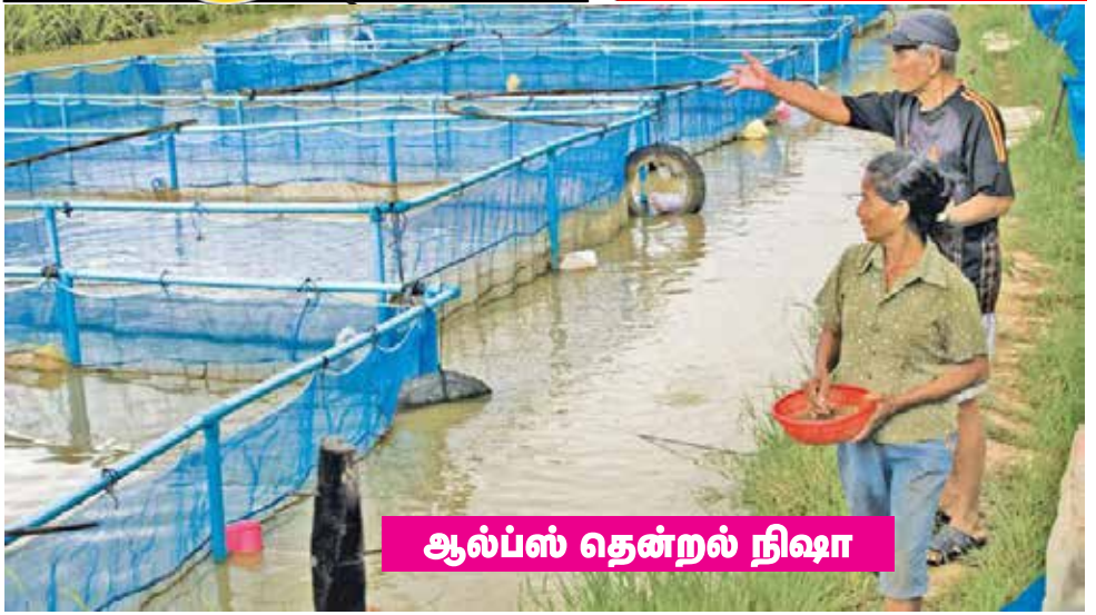
ஆல்ப்ஸ் தென்றல் நிஷா

இயற்கையோடிணைந்த தற்சார்பு வாழ்க்கையை குறித்த மேம்பாட்டுத் திட்டங்களை தொடரும் நாங்கள் கடலை மட்டும் அல்ல நம் நாட்டில் அனைத்து வளங்களையும் (நீர், நிலம், காற்றைக் கூட) பாதுகாக்க வேண்டும் என்பதைத்தான் கடந்த மாதங்களில் காற்றில் கலந்த மாசுக்களும் குளிர்மமாக பெரும் தொகையில் கால் நடைகளின் இறப்பு செய்திகள் எமக்கு எச்சரிக்கை தந்திருக்கின்றன. எங்கோ சென்னையில் உருவாகிய காற்று மாசு முழு இலங்கைக்குள்ளும் பரவிப் பாதிப்பை உருவாக்கியது போல் இயற்கைக்கு மாறான நாம் செய்யும் எல்லாமே எங்கோ என்றோ பாதிப்பை தர தான் செய்யும். அதனால் எமக்கான கடல், நில வளங்களைப் பாதுகாக்க தான் வேண்டும். காசு, பணம், துட்டு, மணி எனக் குறுகிய காலத்தில் பணம் சம்பாதிக்கும் பொருளாதார நோக்கத்தில் எல்லாவற்றை