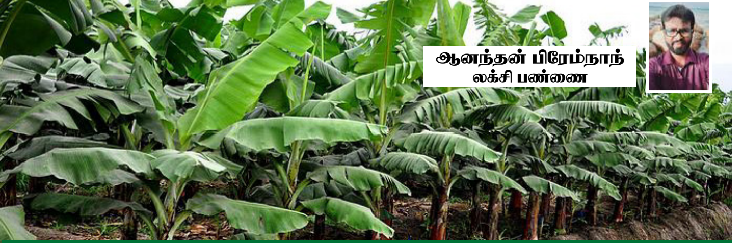
ஆனந்தன் பிரேம்நாந் லக்ஷி பண்ணை