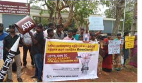
புதிய பங்கு வர்த்திப்புச் சட்டமூலம் ஊடகங்களுக்கும், ஊடகவியலாளர்களுக்கும் பெரும் அச்சுறுத்தல் எனத் தெரிவித்து அதற்கு எதிர்ப்புத் தெரிவித்து கிளிநொச்சி ஊடக அமைப்புகள் ஏற்பாட்டில் கிளிநொச்சி நகரில் இன்று ஆர்ப்பாட்டம் இடம்பெற்றது. கிளிநொச்சி மத்திய பேருந்து நிலையம் முன்பாகக் கூடிய ஊடகவியலாளர்களும் மனித உரிமைப் போராளிகளும் யங்கரவாத எதிர்ப்புச் சட்டத்தை மீள்பரிசீலனை செய்யும்படி வலியுறுத்தி சில மணி நேரம் ஆர்ப்பாட்டத்தில் ஈடுபட்டனர். தமது போர்டம் தொட்பில் கிளிநொச்சி ஊடகவியலாளர்கள் தெரிவித்த ததாவது: மக்களின் உரிமைகள் சார்ந்து, போராட்டங்கள், அரசின் ஜனநாயகவிரோத செயற்பாடுகள் போன்றவற்றைச் சுட்டிக்காட்டி செய்திகள் எழுதினால் அந்தச் செய்தியை பிரசுரித்தால் அது பயங்கரவாதத்தை ஊக்குவித்தல் அல்லது துண்டு விநியோகியானம் (முதலாம் பக்கத் தொட்பிச் செய்தி) செய்யப்பட்டு அந்த ஊடகவியலாளர்களைக் கைது செய்து (02)