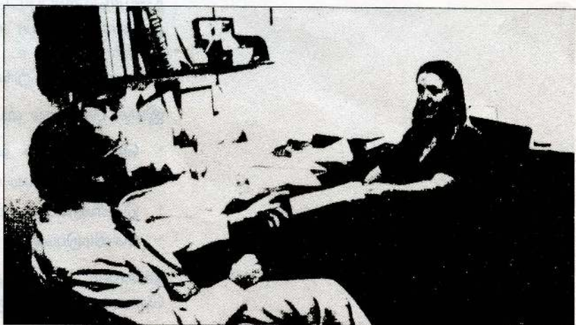
நேருக்குநேர் அமர்ந்து உரையாடும் இருவரின் படம்.

தொடர்பாடல் பற்றிக் கற்பதற்கான ஆயத்தமாகப் பின்வரும் தொழிற்பாட்டில் ஈடுபடுங்கள்.