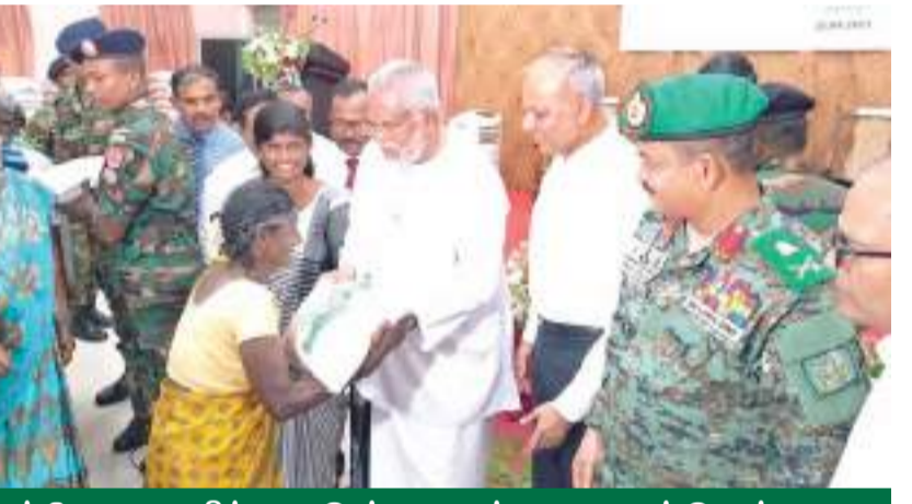
யாழ் வேலையில் நடைபெற்ற குறைந்த வருமானம் பெறும் மக்களுக்கான இலவச அரிசி வழங்கும் இரண்டாம் கட்ட ஆரம்ப நிகழ்வில் ஜனாதிபதியின் சிரேஷ்ட ஆலோசகரும், ஜனாதிபதியின் பணிக் குழாம் பிரதானியுமான சாகவ ரத்நாயக்க

தமிழ், சிங்கள புத்தாண்டுக்கு முன்னதாக ஆரம்பிக்க நடவடிக்கை எடுக்கப்பட்டது. அதன் கிணர் டாம் கட்டம் இன்று யாழ். மாவட்டத்தில் இருந்து ஆரம்பிக்கப்படுகின்றது. இராணுவம் தனது கடமைகளை செய்வதோடு, விவசாய வேலைத் திட்டத்திலும் ஈடுபட்டுள்ளமை இத்திட்டத்தின் சிறப்பம்சமாகும். இத்திட்டத்தில் விளைச்சலுக்காக செலவிடப்பட்ட பணத்தை மீள்பெற்றுக்