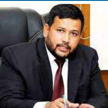
மர்ஹூம் நார்தீன் மகூர் அமைச்சராக இருந்தபோது, அவரது செயலாளராகவும் இருந்து நல்ல பணிகளை ஆற்றியவர்.