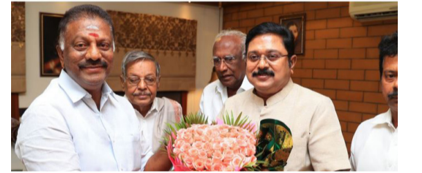
துரோகி தி. மு. க. எதிரி. எம். ஜி. ஆர், ஜெயலலிதா உருவாக்கிய இயக்கத்தை கபலீகரம் செய்தவர்களிடம் இருந்து மீட்டெடுப்பதற்காக நானும் ஓ. பி. எஸ். எம். இணைந்துள்ளோம்" என்று தெரிவித்தார்.

அப்போது பேசிய டி. டி. வி. தினகரன், "ஜெயலலிதாவுடன் உண்மையான தொண்டர்களிடம் கட்சி இருக்க வேண்டும். இலட்சியத்தை அடைவதற்காக இணைந்து செயல்பட முடிவு செய்துள்ளோம். ஓ. பி. எஸ். மீது எனக்கு எப்போதும் தனிப்பட்ட அன்பு உண்டு. இருவரிடையே மனதளவில் பகை உணர்வு கிடையாது. இந்த இணைப்பில் சுயநலம் இல்லை. எங்களைப் பொறுத்தவரை எடப்பாடி பழனிசாமி