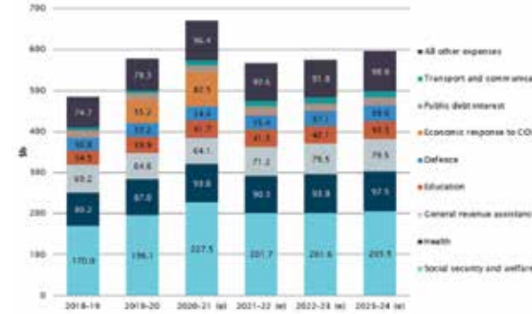
நன்றி - ஆஸ்திரேலியா புள்ளியியல் கழகம்

இதுநாள் வரை கூட்டணிக் கட்சிகளின் பத்திரிகையாளர் சந்திப்புத் திட்டங்களைப் பார்த்து (எந்தவித போதிய பணம் இருப்பிலின்றி வெறும் அறிவிப்பு மட்டும்) ஏமாந்து போன மக்களுக்கு என்னென்ன திட்டங்களையெல்லாம் ஜிம் வைத்திருக்கிறார் என்று தெரியவில்லை. வருகின்ற மே 9 அன்று நமக்கு மொத்த விபரமும் தெரியவரும். இந்த இதழ் உங்கள் கைகளுக்கு வருமுன்னரே உங்களுக்கு தெரிந்த பழைய செய்தியாகிவிடும். இதுவரை செய்த அறிவிப்புகள் படி நிதிநிலைவரத் திட்டத்தில் என்னெவ்வல்லாம் இருக்கலாம் என்பதை தொகுத்திருக்கிறேன்.