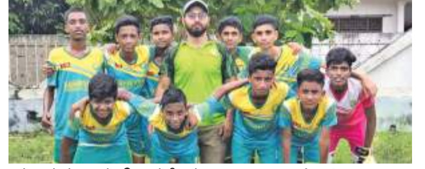
அக்கரைப்பற்று வடக்கு தினகரன் திருபுர்