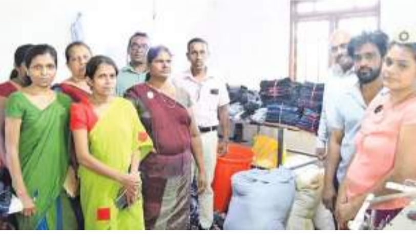
திறப்பண தினகரன் நிருபர்

எதிர்வரும் செப்டம்பர் 9-10 ஆம் திகதிகளில் புதுடில்லியில் நடைபெறவுள்ள ஜி20 உச்சி மாநாட்டுக்குத் தயாராகும் வகையில் இந்தியாவின் பல்வேறு பகுதிகளில் பல்வேறு இலக்குகளைக் கொண்ட கூட்டங்கள் தொடர்ச்சியாக நடத்தப்பட்டு வருகின்றன. கடந்த டிசம்பரில் இந்தியா ஜி20 தலைமையை ஏற்றுக் கொண்டதும் நாட்டெங்கும் 230 தயார் செய்யும் மாநாடுகளை 50 மாநிலங்களில் உள்ள 60 நகரங்களில் நடத்துவதற்கு தீர்மானிக்கப்பட்டது. உத்தரகாண்ட் டிள் ராமநகர், லக்ஷ்னோவில் காவர்த்தி, டுமாம் டியூவின் டியூ தீவு என்பன வற்றிலும் இம் மாநாடுகள் நடத்தப்பட்டன. கடந்த ஐந்து மாதங்களில் 105 மாநாடுகள் நடத்தப்பட்டுவிட்டன. அடுத்த நான்கு மாதங்களில் 125 மாநாடுகள் நடத்தப்படுவதற்கான தீர்மானம் இம்மாதம் 10 மாநாடுகள் நடத்தப்படவிருப்பதாகவும்,