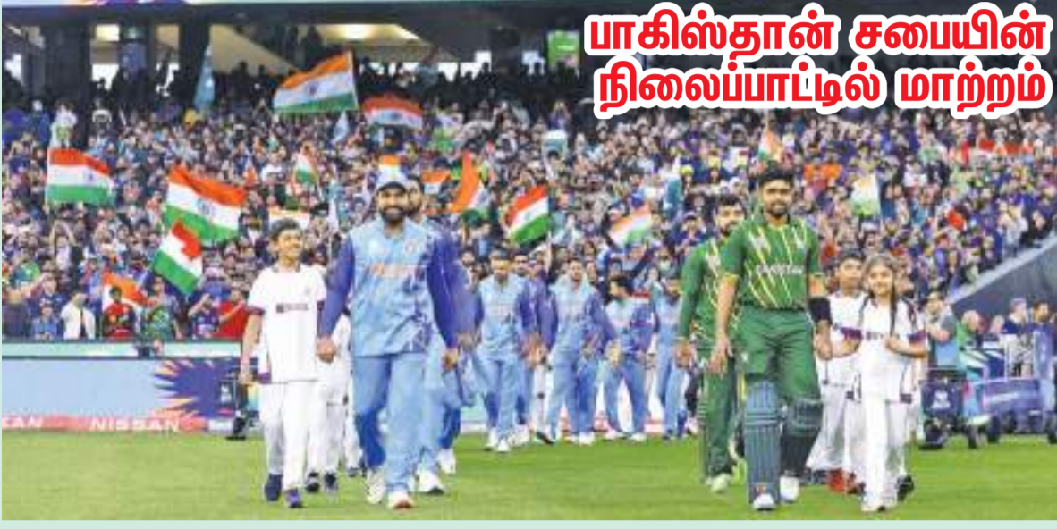
பாகிஸ்தான் சபையின் நிலையாட்டில் மாற்றம்

ஆசிய கிண்ணத்தில் இந்தக் கலப்பு முறை வெற்றி அளித்தால் இந்த ஆண்டு இறுதியில் இந்தியாவில் நடைபெறவுள்ள ஒருநாள் உலகக் கிண்ண போட்டியில் அதனை பயன்படுத்த முடியும் என்று அவர் நம்பிக்கை தெரிவித்துள்ளார்.