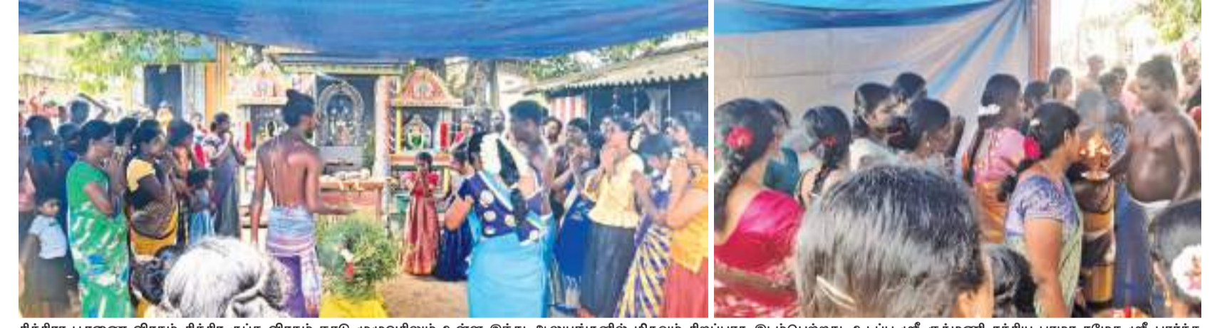
சித்திரா பூரணை விரதம் சித்திர குப்த விரதம் நாடு முழுவதிலும் உள்ள இந்த ஆலயங்களில் மிகவும் சிறப்பாக இடம்பெற்றது. உடப்பு ஸ்ரீ குக்மணி சத்திய பாமா சமேத ஸ்ரீ பார்த்த சாரதிப் பெருமான் திரைபதியம்மன் ஆலயம், உடப்பு ஸ்ரீ வீரபத்திரகாளியம்மன் ஆலயம், ஆண்டமுனை கன்னியம்மன் ஆலயம் போன்றவற்றில் விஷேட பூஜைகள் அன்னதானம் இடம்பெற்றன. (உடப்பு குரூப் நிருபர்)

கான தலைவர், குவாட் அமைப்பின் உறுப்பினர், பிரிக்ஸ் அமைப்பின் உறுப்பினர் என்ற வகையிலும் ஜி7 நாடுகளினால் இந்தியா முக்கியத்துவம் மிக்க நாடாகப் பார்க்கப்படுகிறது. உலகிலேயே அதிக முஸ்லிம்கள் வசிக்கும் ஜனநாயக நாடான இந்தோனீசியாவும் முக்கிய நாடாகக் கருதப்படும் அதேசமயம், உலக நாடுகளுக்கான பொருள் உற்பத்தி மற்றும் விநியோகத்தில் சீனா கொண்டிருக்கும் ஏகபோகத்தை முறித்து அதை இந்தியா, வியட்நாம் மற்றும் இந்தோனீசிய நாடுகளிடம் கையளித்து, புதிய பொருள் உற்பத்தி மற்றும் விநியோக சங்கிலியை ஏற்படுத்தவும் ஜி7 நாடுகள் விரும்புவதாக ஜப்பான் டைம்ஸ் தெரிவித்துள்ளது. சீனாவின் தொழில்நுட்பத் திறன் அதிகரிப்பு, இராணுவ ரீதியான ஆக்கிரமிப்புக் கொள்கை ஆகியவற்றை மட்டுப்படுத்தி தைவானை ஜனநாயக நாடாக நீடிக்கச் செய்வது என்பன சீனா தொடர்பான கொள்கையாக இருக்கும் எனவும் கூறப்பட்டுள்ளது.