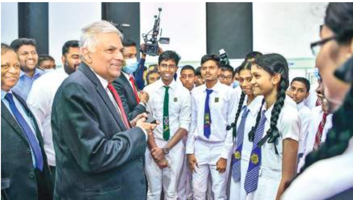
'வாழ்க்கைக்கு திறன், திறனுக்கு தொழில்' என்ற தொனிப்பொருளின் கீழ் பண்டாரநாயக்க குடும்பத்தின் சர்வதேச மாநாட்டு மண்டபத்தில் நடைபெற்றுவரும் Sri Lanka Skills Expo 2023 கண்காட்சியை பார்வையிட ஜனாதிபதி ரணில் விக்கிரமசிங்க, கண்காட்சியை பார்வையிட வந்த மாணவர்களுடன் கலந்துரையாடினார்.