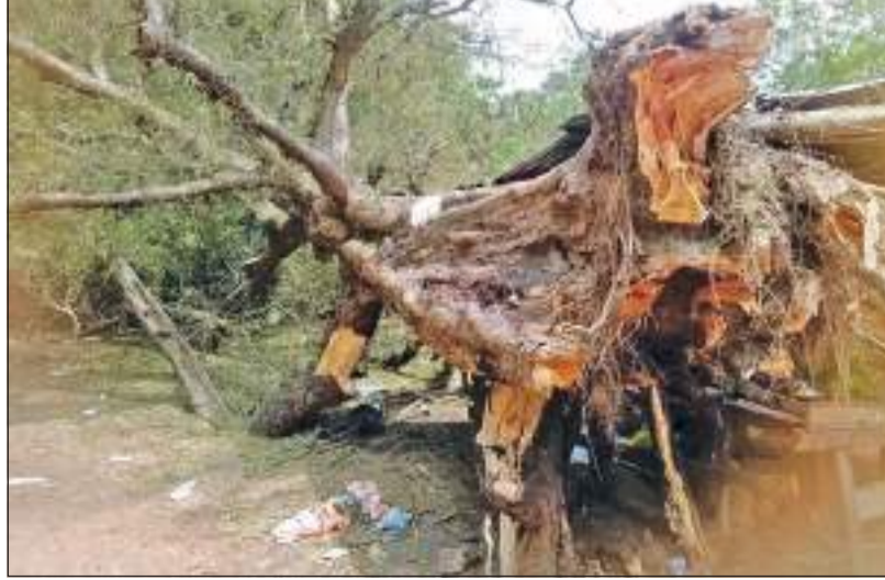
தென்மராட்சிமந்துவில் சின்னச்சந்தைப் பகுதியிலிருந்து 150 வருடங்கள் பழமை வாய்ந்த புளிய மரம், அண்மையில் அடியோடு முறிந்து விழுந்துள்ளது. விழுந்து சிப்கும் மரத்தை படத்தில் காணலாம்.

இதையடுத்தே, இந்நபர் தாக்கப்பட்டார். தாக்கப்பட்டவர், பொலிஸ் செய்த முறைப்பாட்டுக்கமைய விசாரணைகள் முன்னெடுக்கப்பட்டு வருகின்றன.