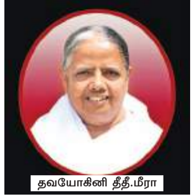
மலையகப் பிரதேசங்களான பதுளை, வெலிமடை, நுவரெலியா, மல்கெலியா, பொலநறுவை

2018 இல் கல்ஷயில் அங்கத்துவ மாணவர்களுக்கு ஆன்மீகக் கல்வியுடன் கூடிய வாழ்க்கைக்கான வழிகாட்டலுடன் பெண் மாணவர்களுக்காக ‘சக்தி பவன்’ மற்றும் ஆண்மாணவர்களுக்காக ‘பாண்டவ பவன்’ எனும் பெயர்களில் பெயரில் தங்குமிடங்கள் அமைக்கப்பட்டுள்ளன.