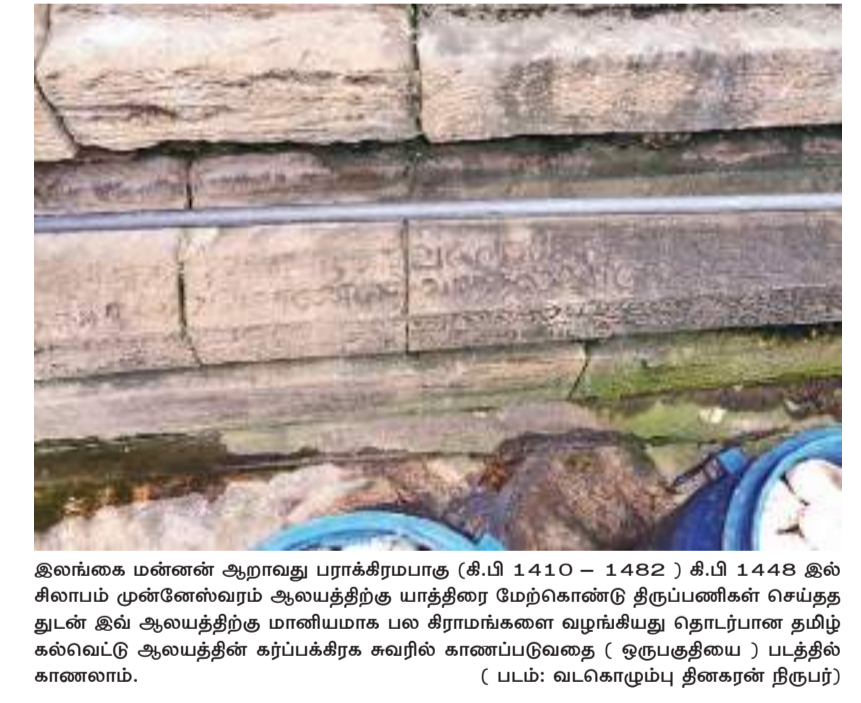
இலங்கை மன்னன் ஆறாவது புராக்கிரமபாது (கி.பி 1410 - 1482) கி.பி 1448 இல் சிலாபம் முன்னேள்வரம் ஆலயத்திற்கு யாத்திரை மேற்கொண்டு திருப்பணிகள் செய்ததுடன் இவ் ஆலயத்திற்கு மானியமாக பல சீராமங்களை வழங்கியது தொடர்பான தமிழ் கல்வெட்டு ஆலயத்தின் கர்ப்பக்கிரக சுவரில் காணப்படுவதை ( ஒருபகுதியில்) படத்தில் காணலாம்.