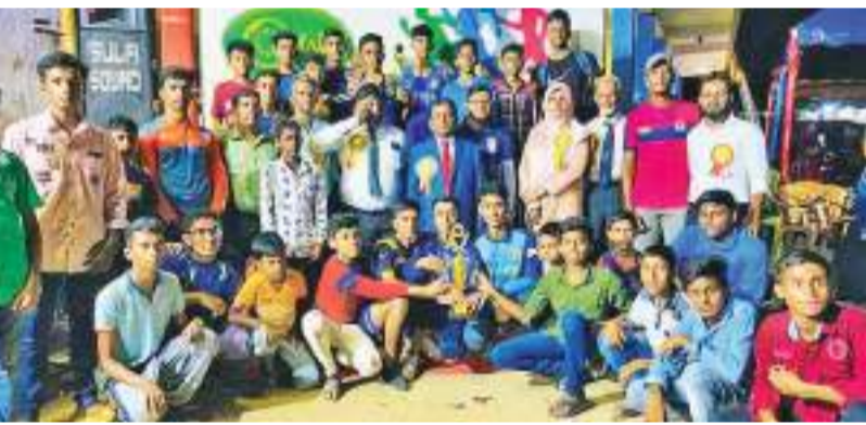
கல்முனை மத்திய தினகரன், பெரிய நீலாவண விசேட நிருபர்கள்