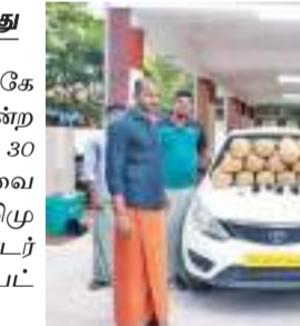
படை பொலிசாருக்கு ரகசிய தகவல் கிடைத்தது. அதன்பேரில் நேற்று அதிகாலை கண்காணிப்பு பணியில் ஈடுபட்டனர். அப்போது அங்கு உள்ள கடற்கரையில் சந்தேகத்துக்கு இடம் அளிக்கும் வகையில் நின்று கொண்டிருந்த காரில் சோதனை செய்த போது அதிலிருந்து பல இலட்சம் பெறுமதியான கஞ்சா கண்டுபிடிக்கப்பட்டது. சொகுசு காரும் பறிமுதல் செய்யப்பட்டுள்ளது.

வேளாங்கண்ணி அருகே இலங்கைக்கு கடத்த முயன்ற ரூ.12 லட்சம் மதிப்புள்ள 30 கிலோ உயர் ரக கஞ்சாவை தனிப்படை பொலிசார் பறிமுதல் செய்தனர். இது தொடர்பாக 2 பேர் கைது செய்யப்பட்டனர்.