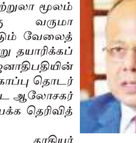
சுகாதார சுற்றுலா மூலம் இலங்கைக்கு வருமானத்தை ஈட்டும் வேலைகளை திட்டம் ஒன்று தயாரிக்கப்படும் என்றும் அவர் குறிப்பிட்டுள்ளார்.

ஜனாதிபதியின் சிரேஷ்ட ஆலோசகர் சாகல ரத்நாயக்க