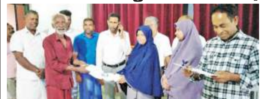
(பெரியநீலவண்ண விசேட நிருபர்)