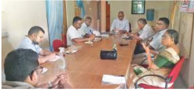
(தலைமன்னார் விசேட நிருபர்)

மன்னார் தம்பவனி காற்றுச்சக்தி செயற்றிட்டத்தை விரிவாக்கும் திட்டத்துக்கு மக்கள் எதிர்ப்புத் தெரிவித்துள்ளதாக மன்னார் பிரஜைகள் மன்றம் கட்டுப்பாட்டுத்துக்கு எதிர்ப்புக்கள் கிளம்பியுள்ளன. இதற்கமைய மன்னார் மாவட்டத்திலிருந்து சுமார் ஏழாயிரத்துக்கு மேற்பட்ட பொதுமக்கள், மன்னார் தம்பவனி காற்றுச்சக்தி செயற்றிட்டத்தின் கொள்ளளவை விரிவுப்படுத்தப்பட வேண்டாமென, கையெழுத்திட்டு மன்னார் பிரஜைகள் குழுவினாடாக சம்பந்தப்பட்ட அதிகாரிகளுக்கு அனுப்பியுள்ளனர்.