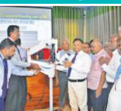
(அட்டாணைச்சேனை குறாப் நிருபர்)

அக் கரைப் பற்று ஆதார வைத்தியசாலையில் நீண்ட நாள் குறையாக இருந்து வரும், கண் சத்திர சிகிச்சைக்கான நுணுக்குக்காட்டி இயந்திரம் ஒன்று, கொமேர்சியல் வங்கியின் சமூக நலன் பிரிவால் வழங்கப்பட்ட