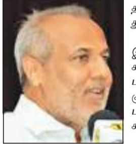
வடக்கு, கிழக்கு மாகாண பிரதேசங்களில் தொடர்ந்தும் காணிகளை அபகரிக்கும் நடவடிக்கைகள் இடம் பெறுமானால் அது இனப்பிரச்சினை தீர்வுக்கான நல்லணக்க செயற்பாடுகளுக்கு பாதிப்பை ஏற்படுத்தும் என ஸ்ரீலங்கா முஸ்லிம் காங்கிரஸின் தலைவர் ரஷ்ய ஹக்கீம் எம். பி பாராளுமன்றத்தில் தெரிவித்தார்.

அதேவேளை, திருகோணமலை பிரதேசத்தில் சியம்நிகாய மஹாராயக்க தேர்களின் மத வழிபாட்டு நிகழ்வை தடுக்க முற்பட்டால் பாரிய அழிவு ஏற்படும் என சரத் வீரசேகர எம்.பி. தெரிவித்திருக்கும் கூற்று பாரிய அச்சுறுத்தலாகும் என்றும் அவர் சபையில் தெரிவித்தார்.