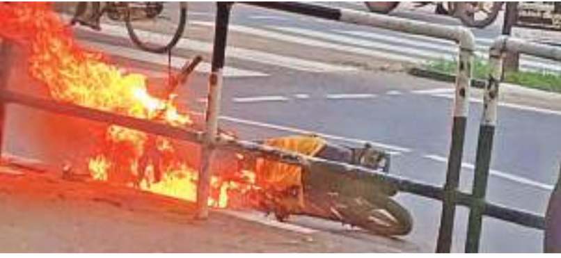
(வவுனியா விசேட நிருபர்)

ஓடிக்கொண்டிருந்த மோட்டார் சைக்கிள் பற்றியதால், பயணித்தோர் பதற்றம்