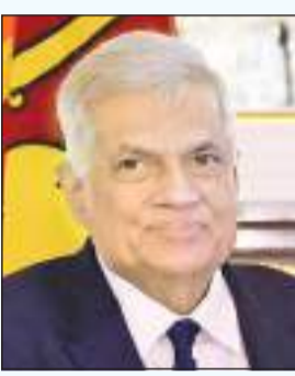
பாராளுமன்ற குழுவிலும் அமெரிக்க செனட் குழுவிலும் காங்கிரஸ் குழுவிலும் அவர்களது சபை உறுப்பினர்கள் மாத்திரமே பங்கேற்க முடியும். ஆனால் நமது பிரதமர்,

இளம் உறுப்பினர்கள் இணைந்துகொண்டுள்ளனர். மேற்பார்வை யாளர்களாக அன்றி பாராளுமன்ற குழுவில் உள்ள இளம் பிரதிநிதிகளாகவே இவர்கள் பங்கெடுத்துள்ளனர். உலகில் முதல் முறையாக இவரும் நினைக்கிறார்கள். இன்று அநேகமான பாராளுமன்றங்களில் குழுநிலைச் செயற்பாடுகள் மூலமே அதிகளவான பணிகள் மேற்கொள்ளப்படுகின்றன.