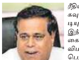
இந்தியாவின் பாதுகாப்பு குறித்து கவனமாக இருக்க வேண்டும் எனவும் இலங்கைக்கும் இந்தியாவுக்கும் இடையில் மிகவும் நட்பு

ஹம் பார்தோட்டை துறைமுகம், போர் அல்லது பாதுகாப்பு நோக்கங்களுக்காக சீனாவின் பாய் படுத்தப்படாமல் இருப்பதை உறுதி செய்துள்ளதாக துறைமுகங்கள், கப்பற்சேவை மற்றும் விமான சேவைகள் அமைச்சர் நிமல் சிறிபால டி சில்வா சர்வதேச ஊடகம் ஒன்றுக்கு தெரிவித்துள்ளார்.