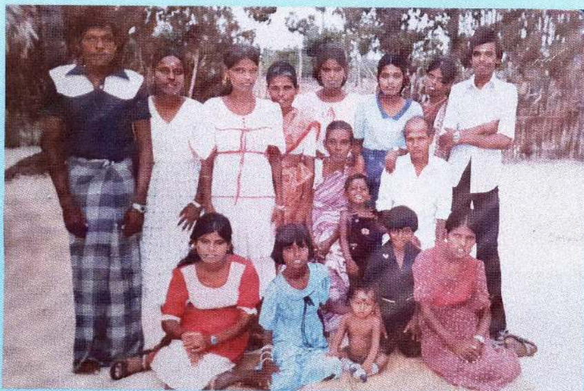
பிள்ளைகள், மருமக்கள், பேரப்பிள்ளைகளுடன்