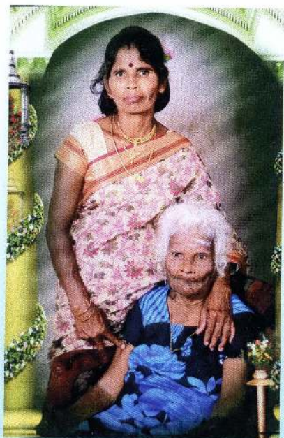
தனது கடைசி மகளுடன்