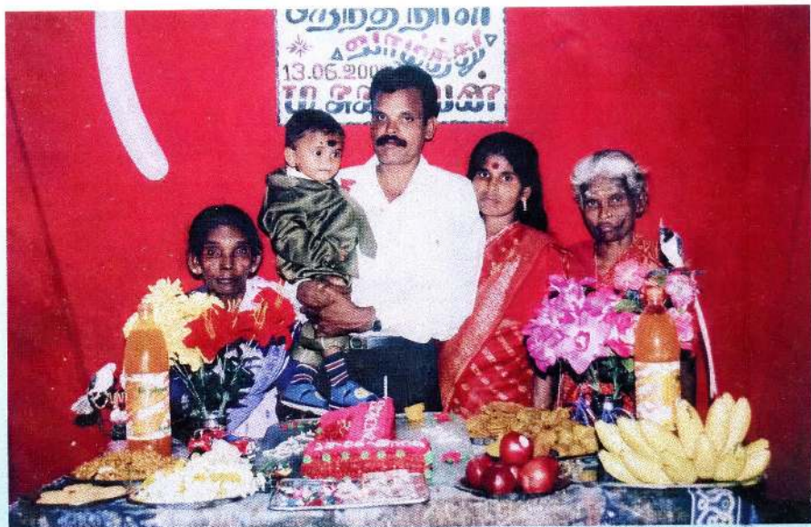
இரண்டாவது மகளின் மூத்த புதல்வனின் 1வது பிறந்த தினத்தில் தனது மகள் மருமகன் மைத்துனி அன்னம்மாவுடன்