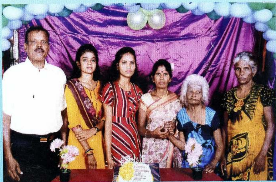
தனது மூத்த மகள் ,கடைசி மகள், மருமகன், பேத்தி, பூட்டியுடன்