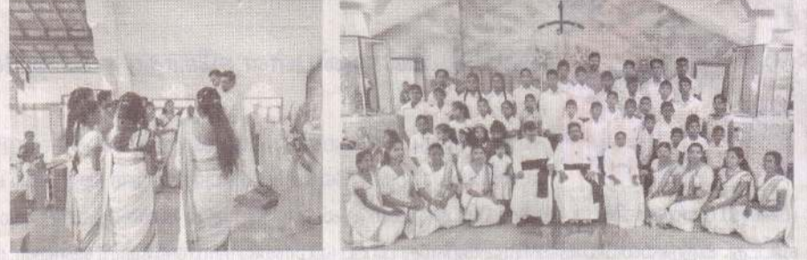
புனித சவேரியார் ஆலயம் - குப்புறுபிட்டி