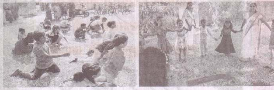
புனித யூதா ததேயு ஆலயம் - இலிங்கநகர்