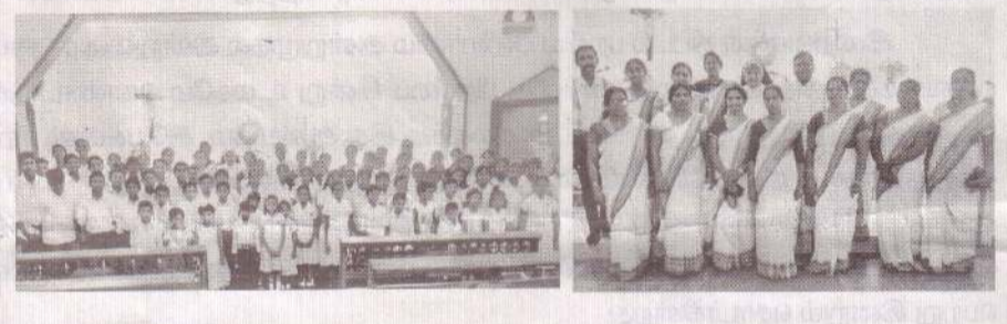
குழுந்தை இயேசு ஆலயம் - உவர்மலை