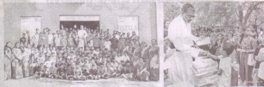
புனித லூர்து அன்னை திருத்தலம் - பாலையூற்று