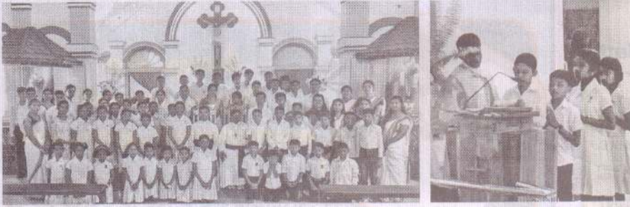
புனித சூசையப்பர் ஆலயம் - நிலாவெளி