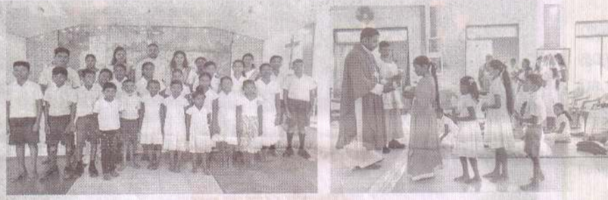
கிறிஸ்து அரசர் ஆலயம் - கன்னியா