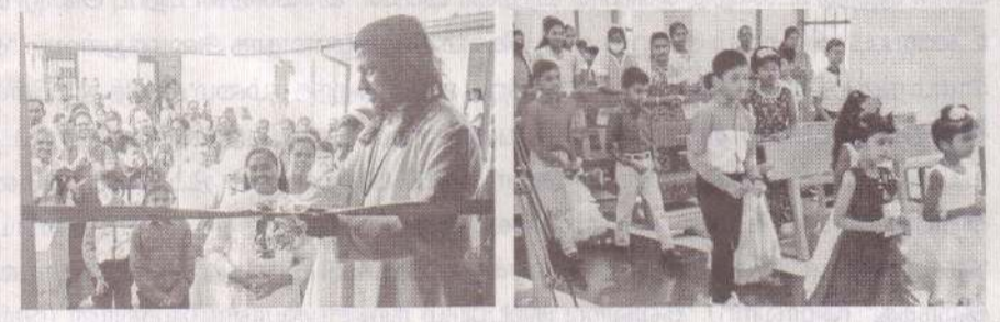
புனித மரியாள் பேராலயம் - திருகோணமலை