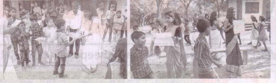
புனித வனத்து அந்தோனியார் ஆலயம் - செல்வநாயகபுரம்