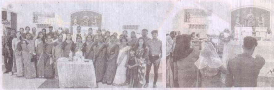
புனித சதாசகாய அன்னை ஆலயம் - அன்புவழிபுரம்