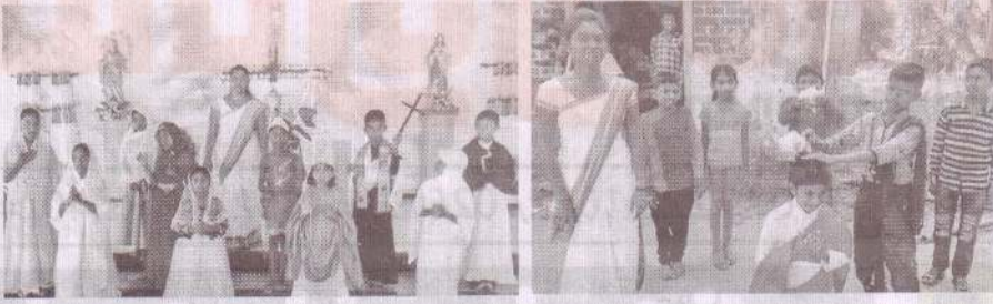
திரு இருதய ஆண்டவர் ஆலயம் - இருதயபுரம்