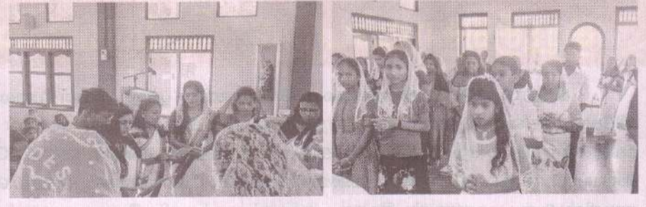
திருமுழுக்கு யோவான் ஆலயம் - சாம்பல்தீவு