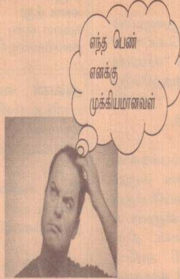
தொகுப்பு : பைரவி

இவற்றில் கீழிருந்து மேல் நோக்கிய அவதானிப்பானது "மூளைய பின்படை" (Posterior parietal cortex) பகுதியிலும் மேலிருந்து கீழ் நோக்கிய அவதானிப்பானது "மூளைய முன்படை" (Prefrontal cortex) பகுதியிலும் ஏற்படுகின்றது என விஞ்ஞானிகள் பாரம்பரியமாக நம்பியிருந்தனர்.