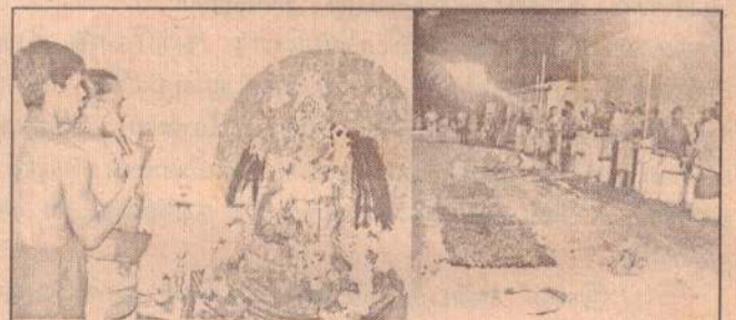
30. 08. 2012 புலம்பெயர்ந்த குற்றவாளிகள் கொண்டு வரப்பட்ட இடம்

சட்ட சீர்திருத்தங்கள் எத்தனை கொண்டு வரப்பட்டாலும் மனிதர்களின் மனங்களில் மாற்றங்கள் கொண்டு வரப்பட வேண்டும். அதுவே குற்றங்கள் குறைய ஒரே வழியாக அமையும். எனவே இது தொடர்பில் சகலருக்கும் விழிப்புணர்வு அவசியமாகிறது. இவை தொடர்பான சட்டங்கள் பற்றிய அறிவு சாதாரண மனிதர்களையும் சென்றடைய வேண்டும். அப்போது தான் குற்றங்கள் குறையும். சட்டங்களும் தண்டனைகளும் கடினமானதாக இருந்தாலும் சமூகம் அவர்கள் தொடர்பில் அக்கறை செலுத்தாவிட்டால் பாதுகாக்க முடியாது. சிறுவருக்கெதிராக குற்றங்கள் புரியப்படும் போது "யாரோ பெற்ற பிள்ளை தானே நமக்கென்ன எனும் போக்குடன் செயற்படக்கூடாது" ஏனெனில் அதே வகையான குற்றம் தொடர்ந்தும் இடம்பெறுவதை தடுக்கவியலாமல் போய்விடும். எனவே சிறுவர் களுடைய நலமான எதிர்காலத்துக்காக உசிதமான சிறுவர் உலகத்தை கட்டியெழுப்ப இதயத்தின் ஆழமான அடித்தளத்தினூடாக அர்ப்பணிப்புச் செய்வோம் என ஒவ்வொருவரும் சபதம் எடுத்துக் கொள்ள வேண்டும். இதுவே இத்தகைய குற்றங்களை முற்றாக கட்டுப்படுத்த ஒரே தீர்வாகும்.