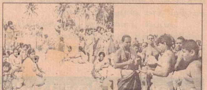
31. 08. 2012 ஆண் வெள்ளை நகல் அழகான பெண் குழந்தை மற்றும் அழகான பெண் குழந்தை

மலைமுருகன் இலத்திரனியல் தொடர்பாடலை மேற்கொள்ள நீங்கள் அஞ்சலிட வேண்டிய முகவரி malaimurasu@hotmail.com செய்திகளை உடனுக்குடன் தெரிவிக்க 0770180218, 0754252042