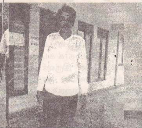
வாக்களித்து விட்டு வெளிவரும் திருக்கோணமலை பிரதமர்கள்