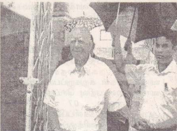
வாக்களித்துவிட்டு வெளிவரும் த.தே.கூ வின் தலைவர்

இத்துண்டுப் பிரசுரங்கள் த.தே.கூவின் நிறம் மற்றும் சின்னங்களை அச்சொட்டாகக் கொண்டிருந்தது மக்களிடையே சிறிய தடுமாற்றத்தை ஏற்படுத்தியிருந்தது. எனினும் துண்டுப் பிரசுரங்கள் வினியோகிக்கத் தடைவிதிக்கப்பட்ட ஒரு இரவில் துண்டுப் பிரசுரங்களை விசிற யாரால் முடியும் என்பதைப் புரிந்து கொண்டவுடன் தமது தயக்கம் அற்றுப் போய்விட்டதாக மக்கள் தெரிவித்தனர்.