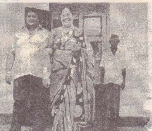
வாக்களித்து விட்டு வெளிவரும் திருக்கோணமலை ஜ.ம.க.மு வின் வேப்பாளர்