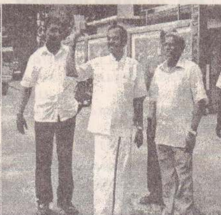
வாக்களிக்க தயாராகும் த.தே.கூ வின் திருக்கோணமலை பிரதம வேப்பாளர்