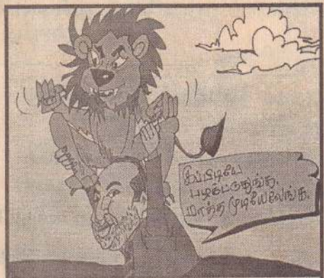
நன்றி - முகப்புத்தகம்