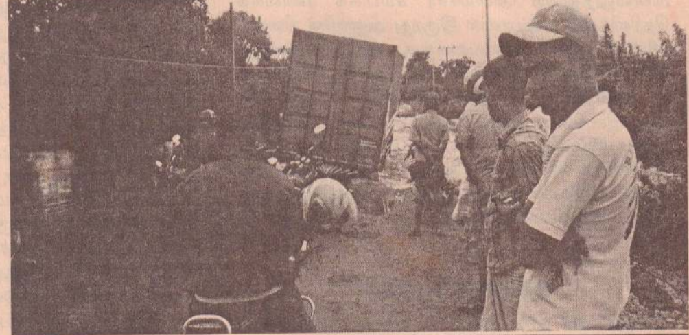
"ரிசானாவின் மரண தண்டனை"

ஊர்தி (கெண்டெய்னர்) தெரு உடைந்ததால் நீரில் மூழ்கியது. அதைத் தொடர்ந்து கற்களை வைத்து ஊர்தியைக் காப்பாற்றிய போதும் போக்குவரத்து அவ் வீதியூடாகத் தடைப்பட்டிருந்தது.