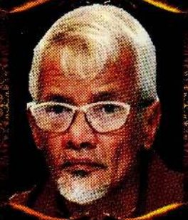
திரு. விகடன் ஜவன்