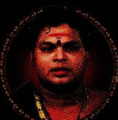
Digitized by Noolaham Foundation. noolaham.org