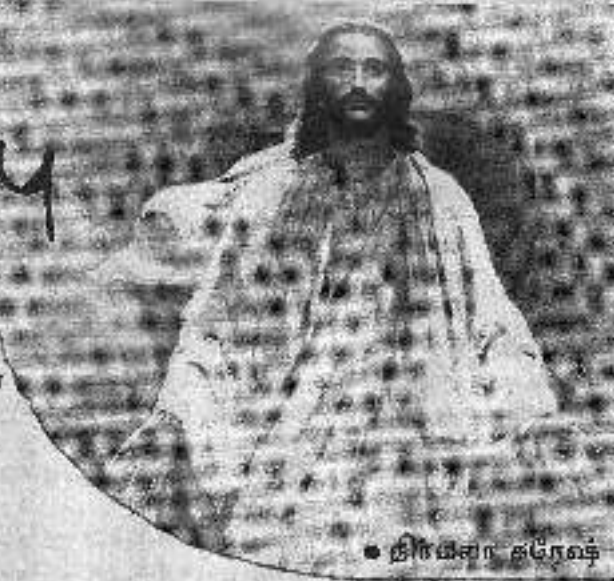
● திருமொழி கரோஷ்

-வெள்ளிக்கிழமை அடக்கமானார் ஞாயிற்றுக்கிழமை தொடக்கமானார் வைகறையில் கல்ஹையில் பொன்னிற உருவங்கள் வந்து புரட்டின குகைக்கல்லை! காவல் வீரர் கவிழ்ந்து வீழ்ந்தார்!