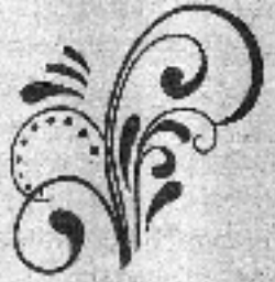
கலைக்கோட்டன் அ. இருதயநாதன்