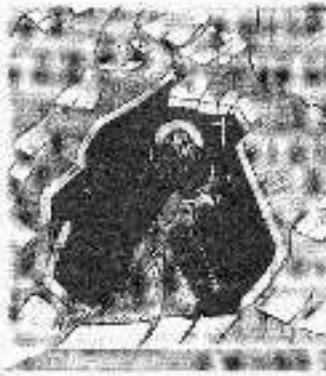
இரு நாள் காலம் அடியு டாக்கிவாலைக்குள்ளேயே நேரம் செல்தார். சுகமயிலே ஏதோ கோங்கை விற்பனையு மானது விண்ணத்தை ஊக்கி மூ மனை உயர்த்தி வைத்தார். சிலவருக்க ளைக்கணித்துக் கொண்டுமே பிளாசிட்டுக்கு வரும் தீதை யோன்று முடிவிலாவதற்குள் சேலிக் கோலுக்கு எங்கு குறவர் உயர்ந்தார்.

ஒரு நாள் சில குறவிகள் பெண்டுகளிடம் காண வந்தனர். "தந்தை பெண்டுகள் அவர்களோடு மனை உச்சியிலுள்ள 3 மடங்களையும் சேர்ந்து குறவிகள் நான்கள் எங்கள் மடங்களுக்கு நினைப் பெறவந்து சிலவர் கடினமாக உள்ளது. நான்கள் தினமும் ஒர் ஒடுக்கிய பானையினாடு பள்ளத்தாக்கிற்கு வரவேண்டும்; ஆற்றிலிருந்து நீரைப் பெறவதற்கு அப்பானை மிகவும் வழுவுட்பானதும் கூட. அதனால் வந்து மடங்களை ஆற்றிற்கு அருகாமையில் அமைக்க அனுமதி தருவது கேட்க வந்துள்ளோம்" என்றார். அவர்களிலுள்ள 11 பிரச்சினைகளைப் புரிந்து கொண்ட தந்தை அவர்களிடம் சிறிய புள்ளைக ளுடன் "மடங்களை இடமற்றும் செய்யமுடியாது. இப் பிரச்சினைக்கான முடிவு நான்கு தெரியும்