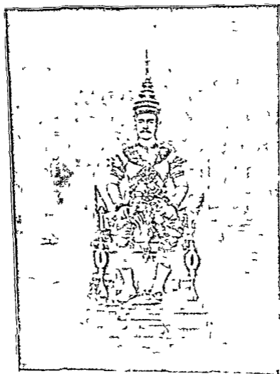
• THE KING OF SAM