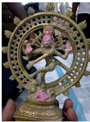
வரையிலானது என்றும் தெரிவிக்கப்படுகின்றது.

சந்தேகநபர் கோவில்லில் இருந்த விகிரகத்தை திருடி, பையில் வைத்துக்கொண்டிருந்த போது, ஓட்டோ சாரதிகளால் பிடிக்கப்பட்டு, வவுனியா பொலிஸாரிடம் ஒப்படைக்கப்பட்டார். திருடப்பட்ட சிலையில் பெறுமதி சுமார் 50,000 ரூபாய்