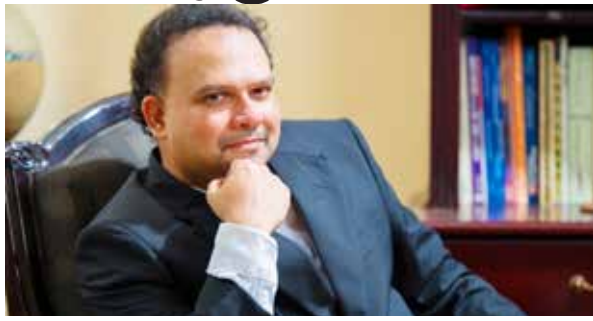
மானித்திருந்தார். இதன்படி புதிய ஆளுநர்கள் இன்று மூன்று மாகாணங்களுக்கான நியமிக்கப்பட்டனர். (02)

நான்குமாகாணங்களுக்கான ஆளுநர் பதவிகளில் மாற்றத்தை ஏற்படுத்துவதற்கு ஜனாதிபதி ரணில் விக்கிரமசிங்க தீர்