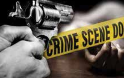
சம்பவ இடத்துக்குச் சென்றதுடன், துப்பாக்கிச் சூட்டில் காயமடைந்த நபர் புதவியா வைத்தியசாலையில் சேர்க்கப்பட்டபோது அவர் உயிரிழந்துள்ளார் என பொலிஸார் குறிப்பிடுகின்றனர்.

புதவியாவின் மஹாசென்புர பிரதேசத்தில் உள்ள வீடொன்றுக்குள் நுழைந்த சிலரால் வர்த்தகர் ஒருவர் சுட்டுக் கொல்லப்பட்டார் என்பது பொலிஸார் தெரிவித்தனர். செவ்வாய்க் கிழமை இரவு இடம்பெற்ற இந்தச் சம்பவத்தில் 38 வயதுடைய இரண்டு பிள்ளைகளின் தந்தையே உயிரிழந்துள்ளார். தேங்காய் எண்ணெய் வர்த்தகம் செய்துவரும் இந்த நபர் இரவில் வீட்டில் இருந்தபோது இரண்டு மே நாட்டார் சைக்கிள்களில் வந்த மூவர் இவரை சுட்டுக் கொன்றனர் என பொலிஸார் தெரிவிக்கின்றனர். இந்த சம்பவம் குறித்து 19 இற்கு கிடைத்த தகவலின் பிரகாரம், பொலிஸார்