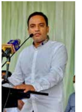
மொட்டுக் கட்சியினர் விரும்புகின்றனர். நாம் எமது கட்சியின் தலைவர் சஜித் பிரேமதாஸையே வேட்பாளராக நிறுத்துவோம். இதில் மாற்றமில்லை. அவரே ஜனாதிபதியாகத் தெரிவாவார்.’ - என்றார். (02)

‘மொட்டுக் கட்சி எம்பிக்களுக்குத் தேர்தலில் விருப்பமில்லை. இவர்களால் தெரிவு செய்யப்பட்ட ஜனாதிபதி ரணில் விக்கிரமசிங்க இவர்களை நல்ல முறையில் பாதுகாத்துக் கொண்டு போகின்றார். இதனால் ரணிலையே ஜனாதிபதி வேட்பாளராக நிறுத்துவதற்கு