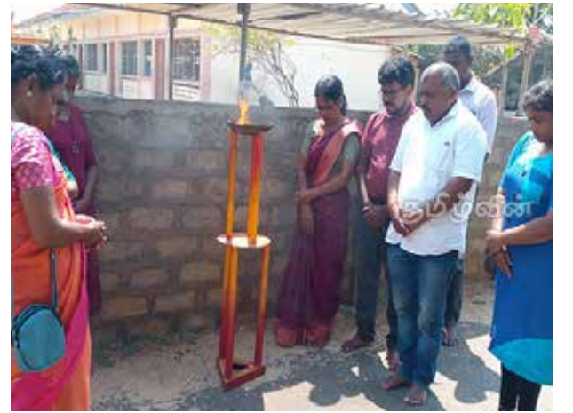
மேற்கொள்ளப்பட்ட தாக்குதலில் உயிரிழந்தமை குறிப்பிடத்தக்க 21 பாடசாலை மாணவர்கள் விடயமாகும். (5)

இலங்கை விமானப்படை யினரால் கடந்த 22.09.1995 அன்று