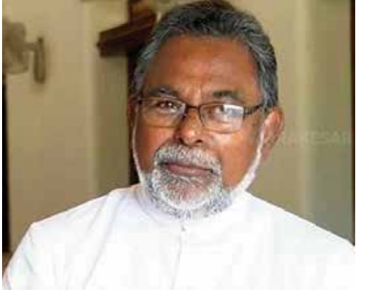
கேட்பதற்கு, பலம்பொருந்திய நபர்கள் இருக்கிறார்களா என்பது தொடர்பில் எமக்குத் தெரியாது. அதுபற்றி தேட வேண்டியது அரசாங்கத்தின் பொறுப்பாகும் என அவர் பதிலளித்தார்.