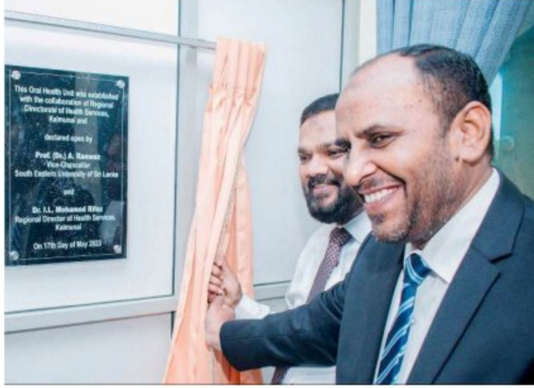
கான விசேட செயற்றிட்டங்களை மேற்கொள்வதென்ற இரு தரப்பு ஒப்பந்தமும் கைச்சாத்திடப்பட்டுள்ளது.

இதற்கமையாக கடந்த ஆறு மாத காலமாக பேசப்பட்டு பல்வேறு முயற்சிகள் எடுக்கப்பட்டு கல்முனை பிராந்திய சுகாதார சேவைகள் பணிமனையின் வாய்ச் சுகாதார பிரிவினால் இலங்கை தென்கிழக்கு பல்கலைக்கழகத்தில் வாய் சுகாதார மேம்பாட்டுப்பிரிவு நேற்று முன்தினம் திறந்து வைக்கப்பட்டதுடன் எதிர்காலத்தில் பணிமனையின் பிரிவுகளினால் மாணவர்கள் மற்றும் கல்விச்சமூகத்திற்கு