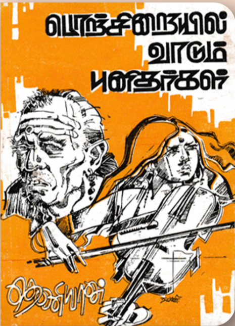
வெண்கலையில் வாழும் ஈழத்தின் மூத்த முற்போக்கு எழுத்தாளர்