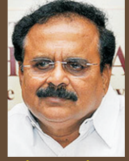
எம்.பி.சுதர்சன நாச்சி அப்பன்

அதனால் எல்லா மக்களுக்கும் ஒரே நாடு, ஒரே சட்டம் என்கிற கருத்துக்கு முன்னுரிமை கொடுக்கப்படும்' எனத் தெரிவித்திருந்தார்.