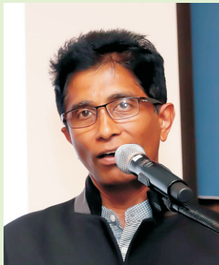
யூட் லால் பர்ணாந்து

இன்றும் சம்பந்தன், சுமந்திரனின் தொடர்ப்பாவாக அரசியல் செய்கிறார். தத்துப்