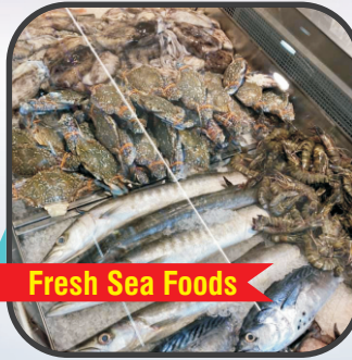
Fresh Sea Foods