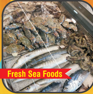
Fresh Sea Foods