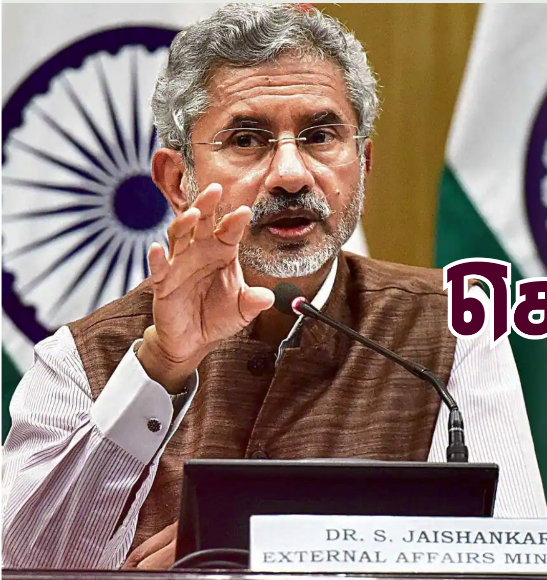
DR. S. JAISHANKAR EXTERNAL AFFAIRS MINISTER