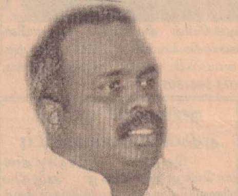
தனிக்கட்சியாகத் தமிழ்த் தேசியக் கூட்டமைப்பை பதிவு செய்வதற்கான புரிந்துணர்வு

“திருமலை மாநாட்டில் டெலோ தீர்மானம்” (மு)