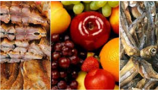
பெறுமாறு அனைத்து பழ இறக்குமதியாளர்களுக்கும் தெரிவிக்கப் பட்டுள்ளது. குறித்த பண்டங்களில் அனுமதிக்கப்பட்ட குறைந்த பட்ச அளவை விட அதிகமாக இல்லை என்பதை உறுதிப்படுத்துமாறு உணவுக் கட்டுப்பாட்டுப் பிரிவு இறக்குமதியாளர்களுக்கு அறிவுறுத்தியுள்ளது. சில இறக்குமதி செய்யப்பட்ட பழங்களில் ஆபத்தான அளவு ஈயம் உள்ளது என்றும் இது மிகவும் நச்சுத்தன்மை வாய்ந்த கன உலோகம் என்றும் தெரியவந்ததை அடுத்து, இறக்குமதி செய்யப்படும் கருவாடுகள் மற்றும் பழங்களில் ஈயம் மற்றும் ஆர்சனிக் உள்ளிட்ட கன உலோகங்கள் உள்ளனவா என்று சோதிக்கப்படுவதை கட்டாயமாக்க அரசாங்கம் தீர்மானித்துள்ளது. (05)

இறக்குமதி செய்யப்படும் அனைத்து உணவுப் பொருள்களிலும் கன உலோகங்களுக்கான பரிசோதனையை ஏற்றுமதி செய்யும் நாட்டிலிருந்து அங்கீகாரம் பெற்ற மற்றும் சுதந்திரமான ஆய்வகத்திலிருந்து அறிக்கையைப்