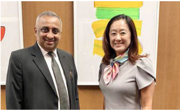
ஊக்குவிக்கிறது எனவும் அவர் சுட்டிக்காட்டியுள்ளார். அத்துடன் நாட்டின் நீதியை நிலைநிறுத்து வதற்கான வேலைத்திட்டங்களை தொடர்ந்தும் முன்னெடுக்குமாறு இலங்கை சட்டத்தரணிகள் சங்கத் திடம் அவர் கோரிக்கை விடுத்தது எனமை சுட்டிக்காட்டத்தக்கது. (05)

இலங்கைக்கான அமெரிக்கா தூதுவர் ஜூலி சங் தனது உத்தியோக பூர்வ ருவிட்ட பக்கபதிவொன்றின் மூலம் குறித்த விடயத்தை தெரிவித்துள்ளார். ஒரு வலுவான சட்டத்தரணைதொழுவிரைகனம் நீதியைப் பின்பிடுவதன் வலி