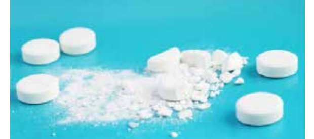
கைது செய்யப்பட்டனர். 28 வயதான இருவரும் முல்லைத்தீவைச் சேர்ந்தவர்கள் எனத் தெரிவித்த பொலிஸார். மேலதிக விசாரணைகளை மேற்கொண்டுவருகின்றனர். (02)

இதன்போது போதையுடும் குளிசைகள் 400 கைதாக்கப்பட்டனர். குற்றச்சாட்டினைக் குறித்த இருவரும்