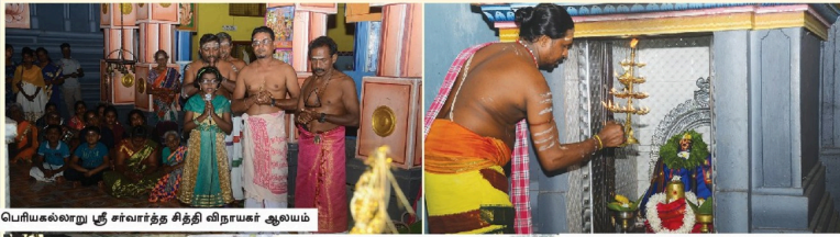
பொய்யல்வாறு சீர்வார்த்த சித்தி விநாயகர் ஆலயம்