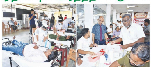
(குட்டபாளையம் செய்தியாளர்) அக்கரைப்பற்று ஆதார வைத்தியசாலை இரத்த வங்கிக்கு அன்பளிப்புச் செய்தும் நோக்கில், அக்கரைப்பற்று தகவா ஜம்ஆப் பள்ளிவாசலினால் ஏற்பாடு செய்யப்பட்ட மாபெரும் இரத்ததான முகாம் பள்ளிவாசலில் சலிக்கிழமை (18) நடைபெற்றது.

அக்கரைப்பற்று ஆதார வைத்தியசாலை பழில் வைத்திய அபிவிருத்தி எம்.எஸ்.எஸ்.ஹரிபாண்டி தலைமையில் நடைபெற்ற இரத்ததான முகாம் பள்ளிவாசலில் சலிக்கிழமை (18) நடைபெற்றது. அக்கரைப்பற்று ஆதார வைத்தியசாலை பழில் வைத்திய அபிவிருத்தி எம்.எஸ்.எஸ்.ஹரிபாண்டி தலைமையில் நடைபெற்ற இரத்ததான முகாம் பள்ளிவாசலில் சலிக்கிழமை (18) நடைபெற்றது.