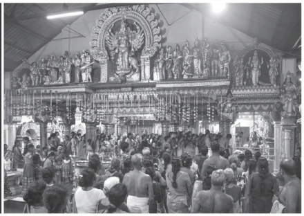
நல்லூர் சிவன் ஆலயத்தில் சிவராத்திரி பூஜை வழிபாடுகள் நேற்று முன்தினம் (18) மிகவும் சிறப்பாக நடைபெற்றன. இப்பூஜை வழிபாட்டில் நூற்றுக்கணக்கான பக்த அடியார்கள் கலந்துகொண்டனர். (யாழ். நிருபர்)