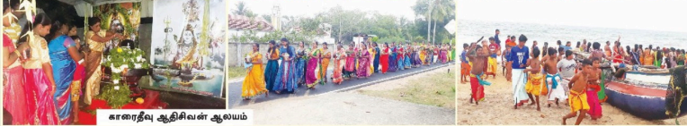
காரைதீவு ஆதிசிலன் ஆலயம்