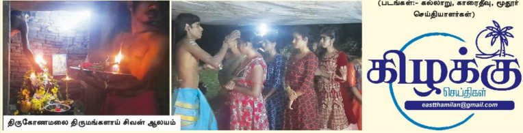
திருகோணமலை திருமங்களாய் சிலன் ஆலயம்

(டபூக்சர்- கல்வாறு, காரைதீவு, மூதூர் செய்வாரர்கள்)