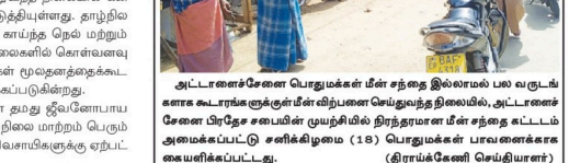
அட்டாணசேனா பொதுமக்கள் மீள் சந்தை இலங்கை பல வருடங்களாக கூடாணசேனா குழுக்கிடையே நடைபெற்று வந்த நிலையில், அட்டாணசேனா பிரதேச சமையின் முறியிழப்பில் திரிதாமசு மீள் சந்தை இலங்கை அமைக்கப்பட்டு சலிக்கிழமை (18) பொதுமக்கள் பாலனைக்காக கையளிக்கப்பட்டது. (திராக்கோணி செய்தியாளர்)

இதன்போது சர்வமத்த குழு பற்றிய செய்திகளை, திருகோணமலை மாவட்ட சாலைப் பிரச்சினைகள், 13 ஆவது சிறிநடுத்தத்தை நடைமுறைப்படுத்துதல், தலைமை அறியும் சட்டத்தை வழங்குதல் மற்றும் திருகோணமலை மாவட்ட மக்களின் பிரச்சினைகள் உள்நிர்வகை கலந்துகொள்ளப்பட்டுள்ளதாக குறிப்பிடத்தக்கது.