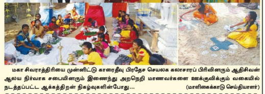
மகா சிவராத்திரியை முன்னிட்டு காரைதீவு பிரதேச செயலக கலாசாரப் பிரிவினரும் ஆதிசிலன் ஆலய நிர்வாக சமையினரும் இணைந்து அருநெறி மணவர்களை ஊக்குவிக்கும் வகையில் நடத்தப்பட்ட ஆக்கத்திறன் திமழ்வுவிளம்பரோடு... (மாரீசைகாரர் செய்வாரர்கள்)