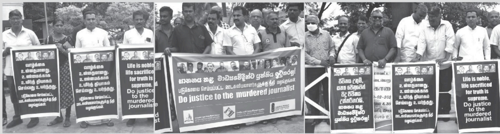
(சாத்தான்குடி செய்தியானர்) "படுகொலை செய்யப்பட்ட ஊடகவியலாளர்களுக்கு நீதி வழங்குங்கள்" என்ற தொலைப் போரூறியை போராட்டமென்று

சனிக்கிழமை (18) மட்டக்களப்பு சாத்தியான்குடி பூங்காவில் நடைபெற்றது. கிழக்கு மானச ஊடகவியலாளர் ஒன்றியம், யாழ். ஊடக அமைப்பும், தொழிலாளர் இணைய