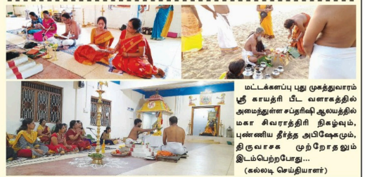
மட்டக்களப்பு பூது முகத்துவாரம் ஸ்ரீ சாயத்திரி பீட வளாகத்தில் அமைந்துள்ள சபரிநி ஆலயத்தில் மகா சிவராத்திரி திமழ்வு, புன்னைய தீர்த்த அபிஷேகமும், திருவாரச முந்நோதலும் இடம்பெற்றனோடு... (கல்வாறு செய்வாரர்கள்)