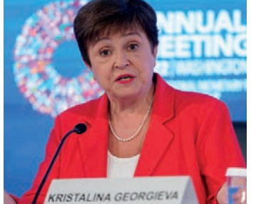
கிறிஸ்டலினா ஜார்ஜீவா தெரிவித்துள்ளார்.

இலங்கை போன்ற நாடுகளுக்கு அவசர கடன் நிவாரணம் கிடைக்க வேண்டும் என்று தொடர்ந்து வலியுறுத்துவதாகவும், இது தொடர்பில் பாரிஸ் கிளப் அங்கத்துவ நாடுகளுடனும், இந்தியா மற்றும் சீனா உள்ளிட்ட பாரிஸ் கிளப் அங்கத்துவமற்ற நாடுகளுடனும் கலந்துரையாடி வருவதாகவும் சர்வதேச நாணய நிதியத்தின் நிர்வாக இயக்குநர்