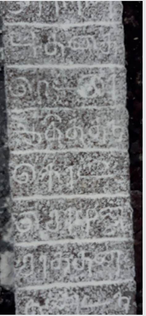
என்பது, சில வரலாற்று ஆசிரியர்களுடைய கருத்தாகும்.

யார் இந்த வேளைக்காரர்? சோழர் ஆட்சிக் காலத்தில் மன்னர்களுக்குப் பாதுகாப்பளிக்கும் போர்களில் பங்குகொண்டும் பெரிதும் உதவிய ஒரு படைப் பிரிவினர் இந்த வேளைக்காரர் ஆவர். 'ஆபத்து வேளையில் உதவுவோர்' என்ற காரணத்தால், அவர்கள் 'வேளைக்காரர்' என்ற பெயரைப் பெற்றனர்.