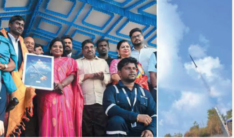
செயற்கைக்கோள்களை உருவாக்கியுள்ளனர். அந்தவகையில் நேற்றுமுன்தினம் குறித்த 150 செயற்கைக்கோள்களைச் சுமந்து கொண்டு 'ஹைபிரிட்' ரொக்கெட், செங்கல்பட்டு மாவட்டம் பட்டிபுலம் கிராமத்தில் இருந்து காலை 8.10 மணிக்கு வெற்றிகரமாக விண்ணில் பாய்ந்துள்ளதாகத் தெரிவிக்கப்பட்டுள்ளது.

இந்தியாவில் அண்மையில் 'டாக்டர் ஏ.பி. ஜே.அப்துல் கலாம் செயற்கைக்கோள் ஏவும் திட்டம்' அறிமுகப்படுத்தப்பட்டது. இத் திட்டத்தின் கீழ் இந்தியா முழுவதும் உள்ள 6ஆம் வகுப்பு முதல் 12ஆம் வகுப்பைச் சேர்ந்த 5000 மாணவர்கள் இணைக்கப்பட்டு அவர்களுக்கு செயற்கைக்கோள் தொழில்நுட்பம், அறிவியல் தொழில்நுட்பம், பொறியியல் மற்றும் கணிதம் தொடர்பான பயிற்சிகள் அளிக்கப்பட்டன. இந்நிலையில் இப் பயிற்சிகளைப் பெற்ற மாணவர்கள் 'பைக்கோ-செயற்கைக்கோள்கள்' என்ற பெயரில் 1 கிலோகிராமிற்கும் குறைவான எடை கொண்ட சுமார் 150 சிறிய ரக