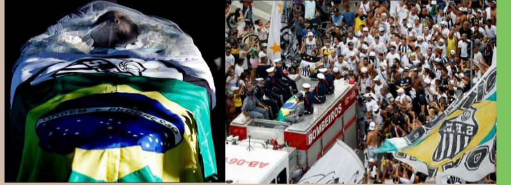
தொடர்பு உண்டு. சாண்டோஸைத் தவிர, பிரேஸிலிய கிளப்புகளின்