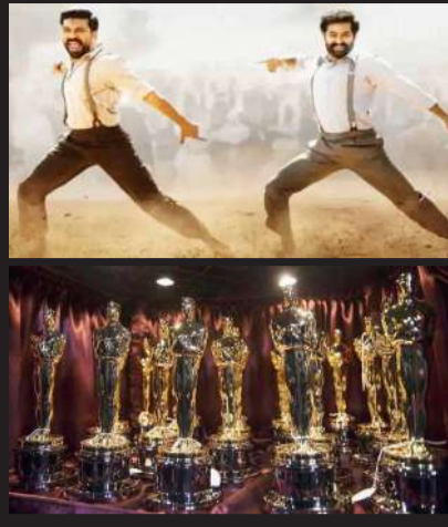
ரசிகர்களிடம் நல்ல வரவேற்பைப் பெற்ற இந்தப் படம் தற்போது ஒஸ்கார் போட்டியிலும் களமிறங்கி