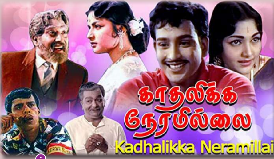
காதலிக்க நேரமில்லை Kadhalikka Neramillai

ஸ்ரீ தரின் வெற்றிப்படங்களின் வரிசையில் காதலிக்க நேரமில்லை முக்கியமானது. ரவிச்சந்திரன், காஞ்சனா ஆகிய இருவரும் சினிமாவில் அறிமுகமான படம் நகைச்சுவைப் படமான காதலிக்க நேரமில்லை ரசிகர்களை மகிழ்வித்தது. இயக்குநர் ஸ்ரீதரும் கவிஞர் கண்ணதாசனும் மிகவும் நெருக்கமான நண்பர்கள். இடைக்கிடை