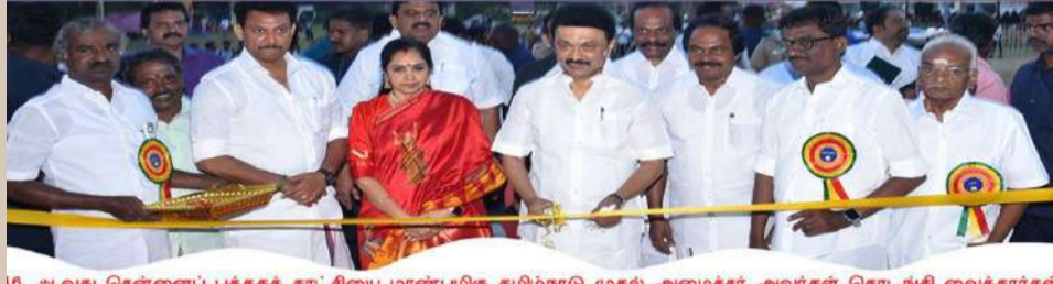
16 ஆவது சென்னைப் புத்தகக் காட்சியை மாண்புமிகு தமிழ்நாடு முதல் அமைச்சர் அவர்கள் தொடங்கி வைத்தார்கள்